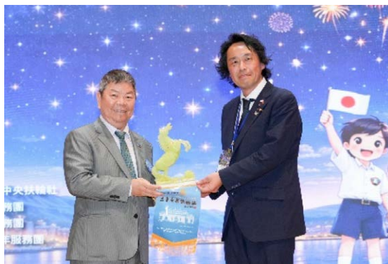
三重中央 RC 会長より記念品の贈呈