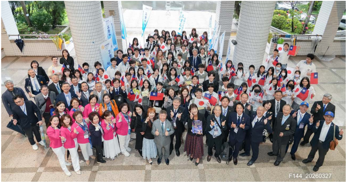
三重高級中学正面にてロータリアン・生徒による記念撮影