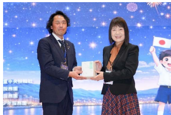
2840 地区より三重高級中学校へ記念品の贈呈