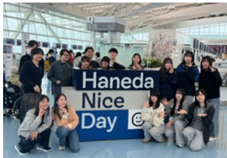
羽田空港にて出発前

本事業は、コロナ禍を明け昨年度より隔年実施で再開した国際交流事業として、2026年度は第2560地区をホストとして開催しました。第2840地区より5名、第2560地区より3名、顧問教諭1名、インターアクター16名の計25名が、3月26日から29日までの4日間、台湾・台北市および新北市を訪問しました。現地では、新北私立三重高級中学及び三重中央ロータリークラブの皆様のご協力のもと、学校交流、ホームステイ、報告会等を通じて有意義な国際交流を実施することができました。なお、添乗は昨年度に引き続きクラブツーリズム小林聡様にお願いしました。