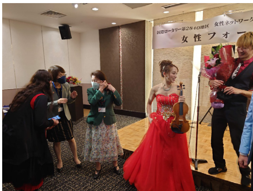
終了後の和気あいあいとした様子