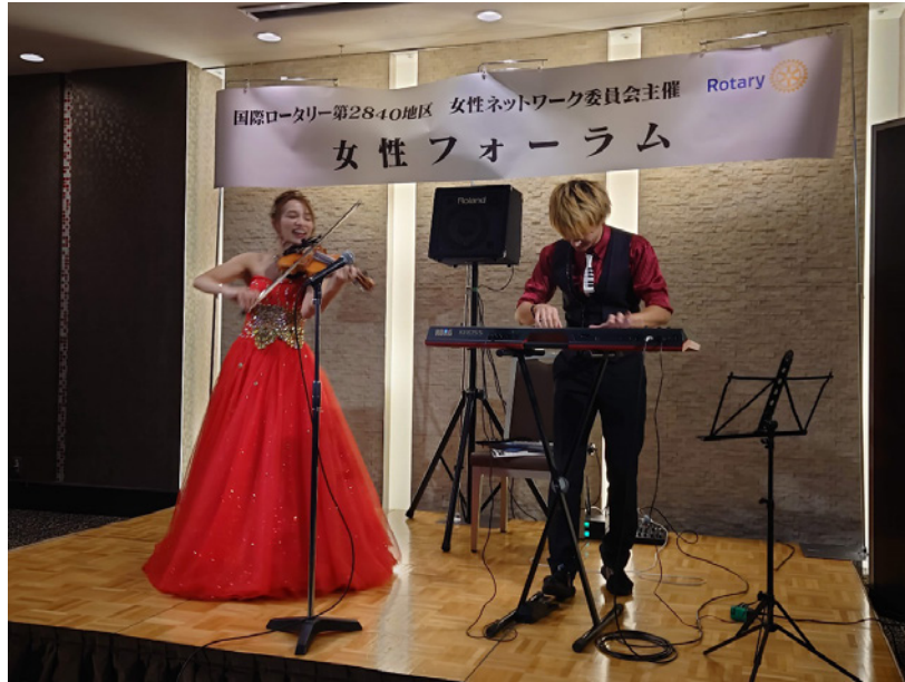
音楽ユニットCiel(シエル)の演奏