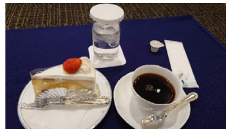
アフタヌーンティー タイム