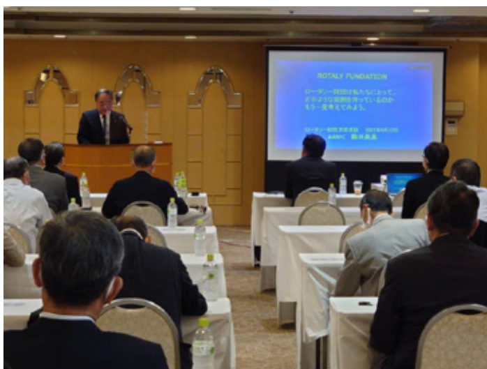
2022年9月17日 第2700地区 財団セミナー

それまでも個人として財団への寄付も続けておりましたし、国際財団活動の一環にも携わらせておりました。しかし実際に担当地域の会員の皆様へ、貴重な浄財の積極的なご寄付を推進する役目となりますと、中々難しい状況もありました。昨年コロナ禍はまた完全には収まっておらず、つい最近まで例会の開催がなされていないクラブもありました。地域差はあるかもしれませんが、九州地区では、クラブ例会や財団セミナーなどがリアルで行えないと、実際に皆様方の寄付行為への熱意を高めることができず、寄付額が伸び悩んでおりました。財団セミナーを ZOOM 等用いて、補助金活動の原資は、地区内会員の皆様からの年次基金が直接反映していることなど、お話していたつもりですが、やはりリアルのセミナーでないと伝わりにくいのだと危惧いたしました。唯、九州内では各地区に大口寄付をお願いさせていただきましたら、各財団委員長や委員会の皆様方のご協力も頂き、アーチ・クランフ・ソサエティ (AKS) や冠名基金等に新たにご協力頂くことができました。これには感謝の気持ちでいっぱいです。今年の秋葉になりまして各地区の補助金セミナーや財団セミナーが再開されておりますので、私も参加させていただいて、年次基金の意味や大切さと恒久基金への寄付の目的の違い等を各クラブの代表の方に直接お話させていただいております。直接の効果が解るのは来年の7月以降ですが、粘り強くお話を続けてまいります。