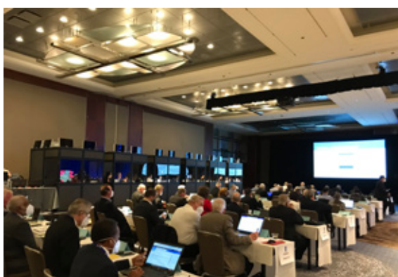
規定審議会の会場風景。左奥に各国語の同時通訳ブースが並ぶ

最後にニュースです。改正された組織規定(RI定款、RI細則、標準ロータリークラブ定款)および推奨ロータリークラブ定款の入手法は前月10月号の連載レポート末尾(6ページ)でご案内した通りです。この組織規定は、今後発行される日本語版の『2022年手続要覧』に掲載されるともご案内しておりましたが、今回、提供されるのはPDFのみで冊子の形では発行しないとRIより通知がありました。他の地区でPDFを印刷して地区内クラブに提供しようと検討していますので、2840地区もその動きにジョイントして、地区内クラブに提供することを検討しています。(12月ごろ予定)もう一つ、現在2022年決議審議会の投票が11月1日までの期間で進行中です。次回最終回のレポートでそのご報告も少しする予定です。