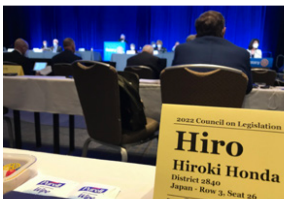
私が座った席から議長席・発表席を臨む。私がシカゴの直接会合に出席した証拠写真