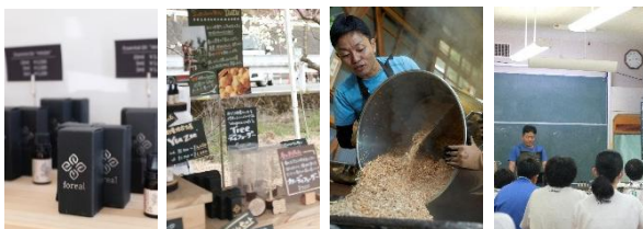
2024.01 オンラインショップ開設 2024.04 花桃街道 イベント出店開始 2024.08 直販所及び体験ツアー開始 2024.09 総合学習授業講師