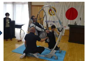
②リモコン操作で上昇