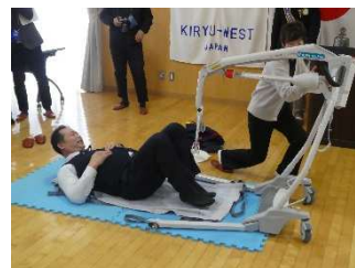
①体の下にカバーを敷き移動式リフトのフックにセットします

我々の療育センターきぼうの職員ですが、男性が106名、女性が201名おります。平均年齢が45.2歳です。やはり介護職の方は約3分に2くらいが腰痛というのを抱えてまして、また、介護職の半分くらいの方が腰痛が原因で離職という選択肢を考えるくらい深刻な問題だと言っています。厚生労働省も腰痛対策を！と言うことで、ここ近年対策が進んでおりますが、我々としても教育をしたり、非常に希ですがこの様に“リフト”をいただいて、機械を使って、介護・介助・看護をすると言うことを行っておりますので、この様な素晴らしい物をいただきまして誠にありがとうございます。これで、我々の職員さんの腰痛も少し良くなり、離職等も減るとラッキーかなと思います。この度は本当にありがとうございました。