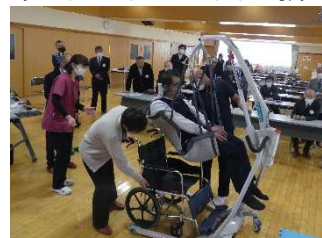
④車椅子の所までリフトを移動させるのもとてもスムーズ