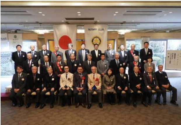
富岡中央 RC 1月18日