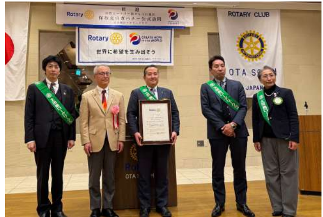
太田南 RC 1月23日