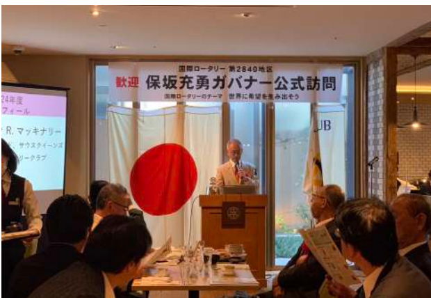
高崎北 RC 1月24日