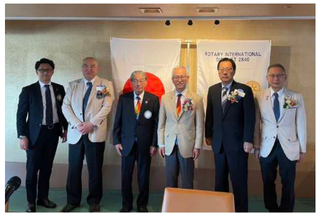
前橋西 RC 1月26日