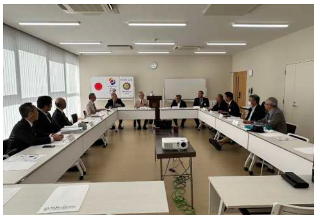
中之条 RC 10月10日