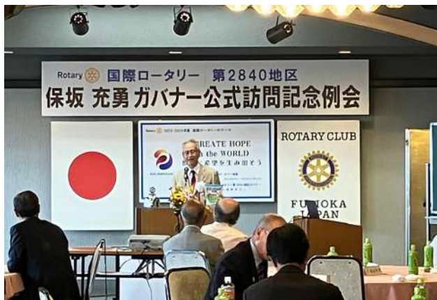
藤岡 RC 9月21日