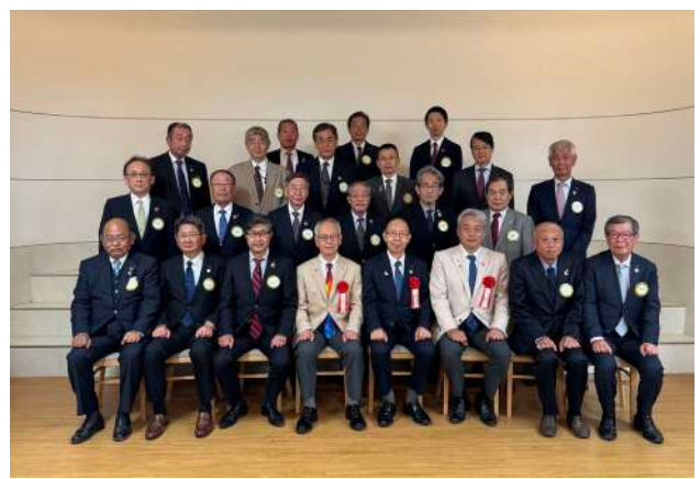
高崎セントラル RC 10月24日