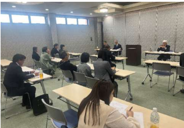
保護者オリエンテーション