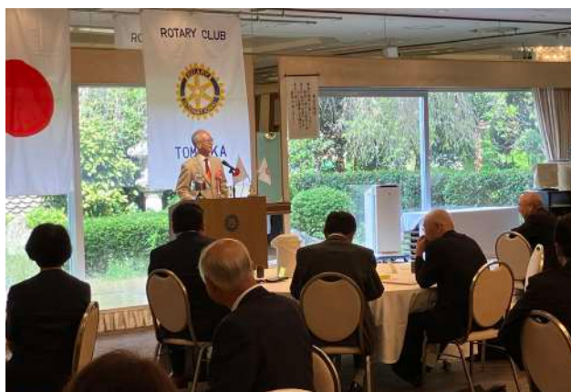
富岡 RC 9月27日