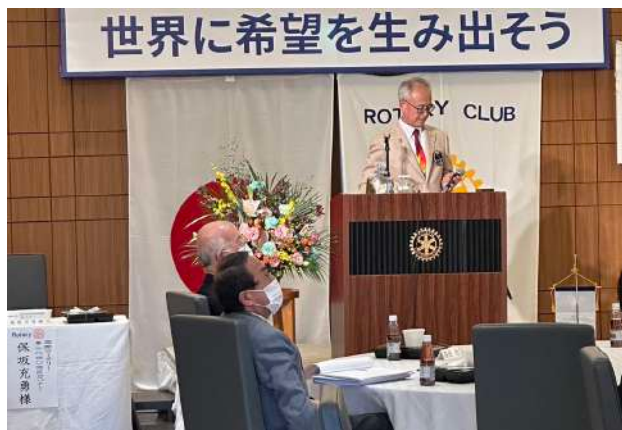
渋川 RC 10月12日