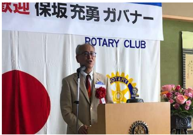
桐生西 RC 10月13日