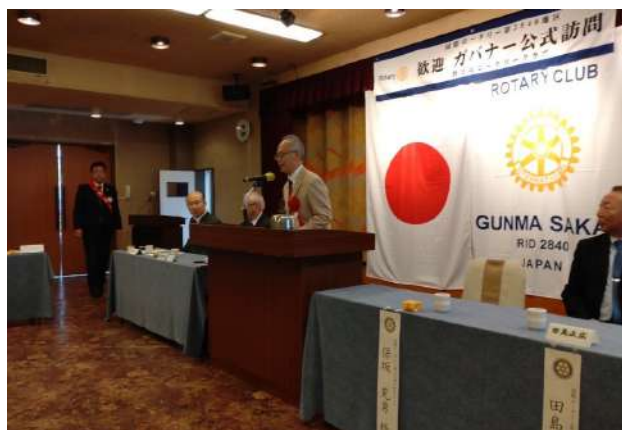
群馬境 RC 10月5日