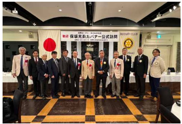
高崎 RC 10月16日