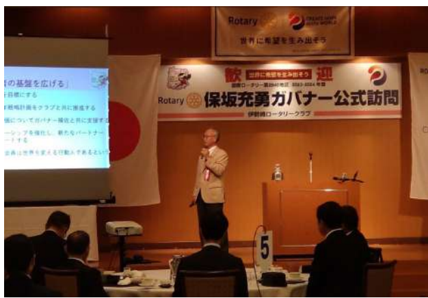
伊勢崎 RC 10月18日