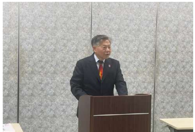
森 GE 講評