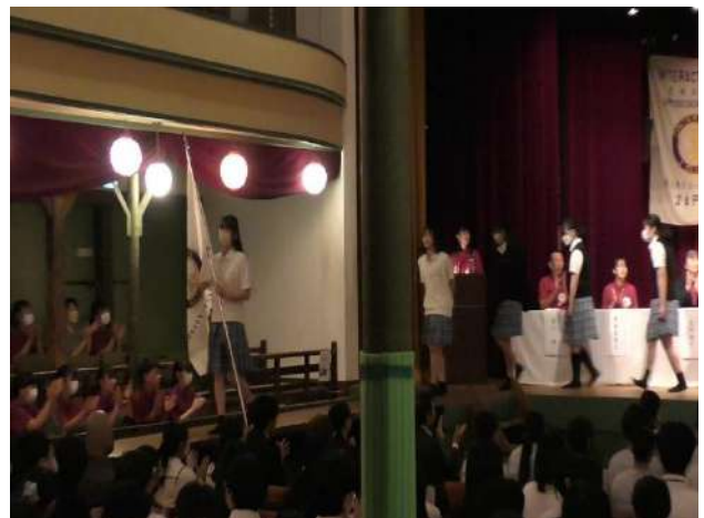
花道を通して舞台を降りる高崎健康福祉大学高崎高等学校の 皆さん

新型コロナウイルス対策が緩和された後の初めての年次大会でしたが、ご多忙中にもかかわらず参加くださいました来賓の皆様をはじめ日頃よりお世話になっている顧問教諭や学校関係者の皆様、さらには提唱クラブのロータリアンの皆様、この大会に参加くださいましたすべての皆様に心より感謝申し上げます。2023-2024年度インターアクト年次大会が滞りなく無事に終了いたしました。