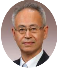
ガバナー 保坂 充 勇