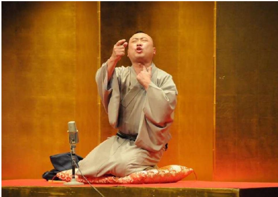
基調講演にて「落語の聞き方」「初天神」を演じる桂 宮治師匠