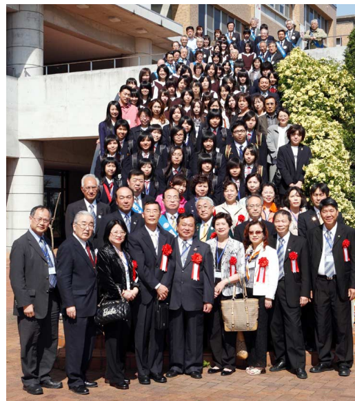
共愛学園到着後の記念撮影