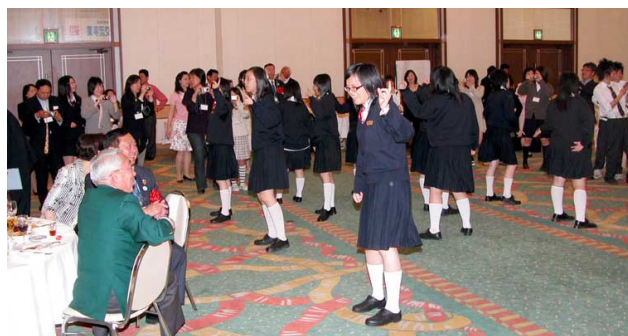
さよならパーティーでダンスを披露する台湾の学生