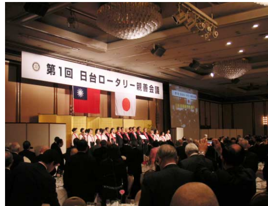
第1回日台ロータリー親善会議の会場風景