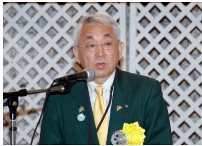
横山公一ガバナー挨拶