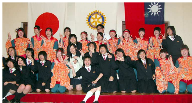
さよならパーティー「ファイト!八木節」の後の記念撮影