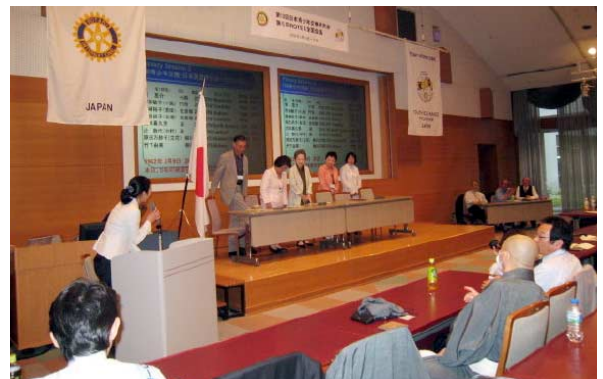
研究会 青少年交換一期生