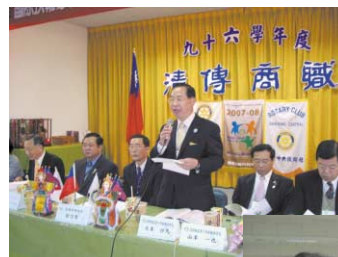
挨拶する大本委員長