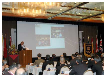
松倉GEの国際協議会報告