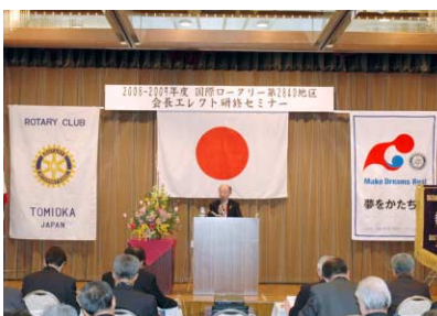
清研修リーダーの講義