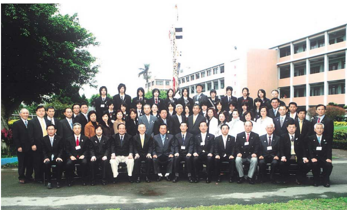
清傳高級商業職業学校での記念撮影