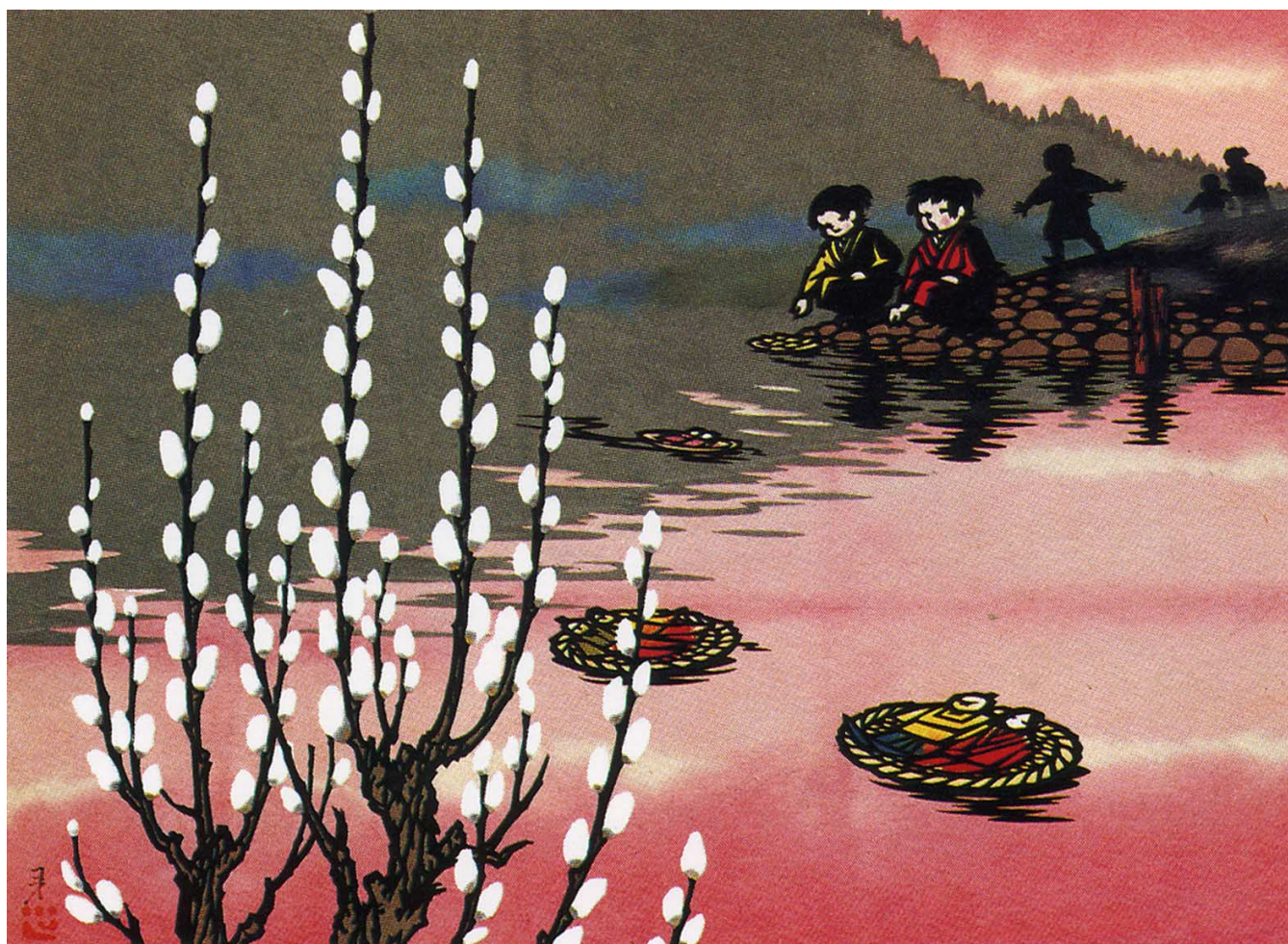
関口ココ 切絵・沼田ロータリークラブ 角田隆 蔵