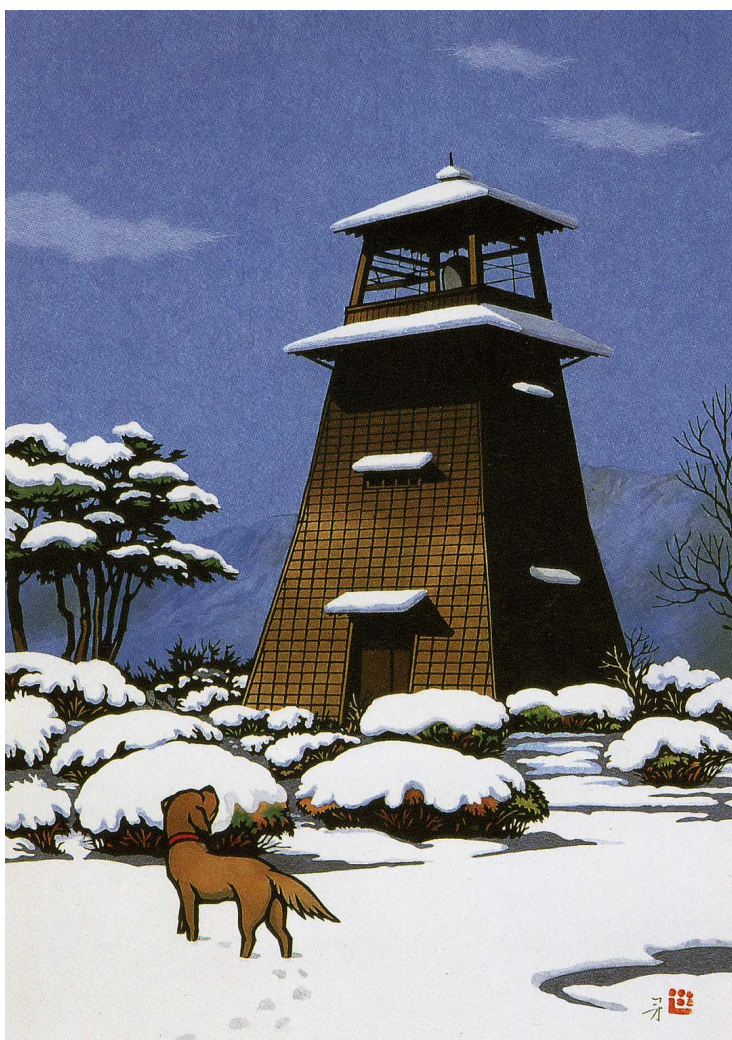
関口コオ 切絵・沼田ロータリークラブ 角田隆 蔵