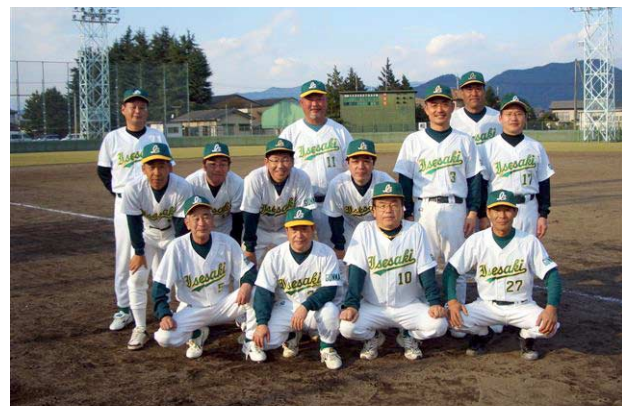
準優勝の伊勢崎南RC