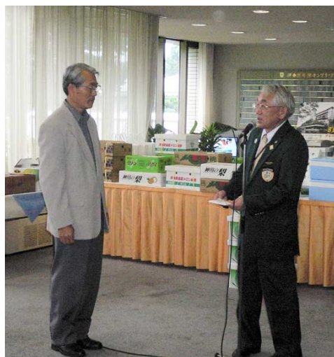
チャリティー益金の贈呈