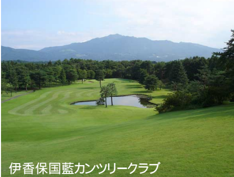
伊香保国藍カンツリークラブ

地区大会ゴルフコンペが9月2日(日)に伊香保国際カンツリークラブにて開催されました。