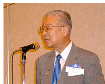
長谷川地区幹事挨拶