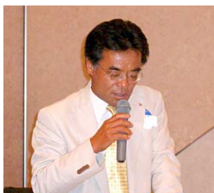
司会の竹内副幹事