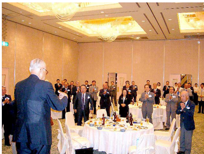
高木パストガバナーの締めで閉会