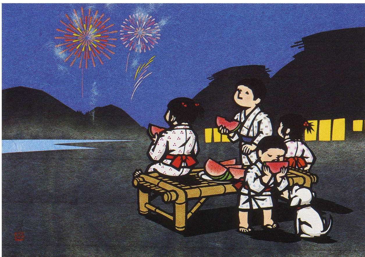
関口コオ 切絵・沼田ロータリークラブ 角田隆 蔵