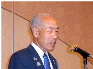
津久井ガバナー挨拶

なお、ガバナー補佐と地区委員長の年間報告は、津久井年度報告書に掲載される予定ですのでご覧下さい。