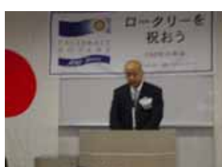
坪井新世代奉仕委員長