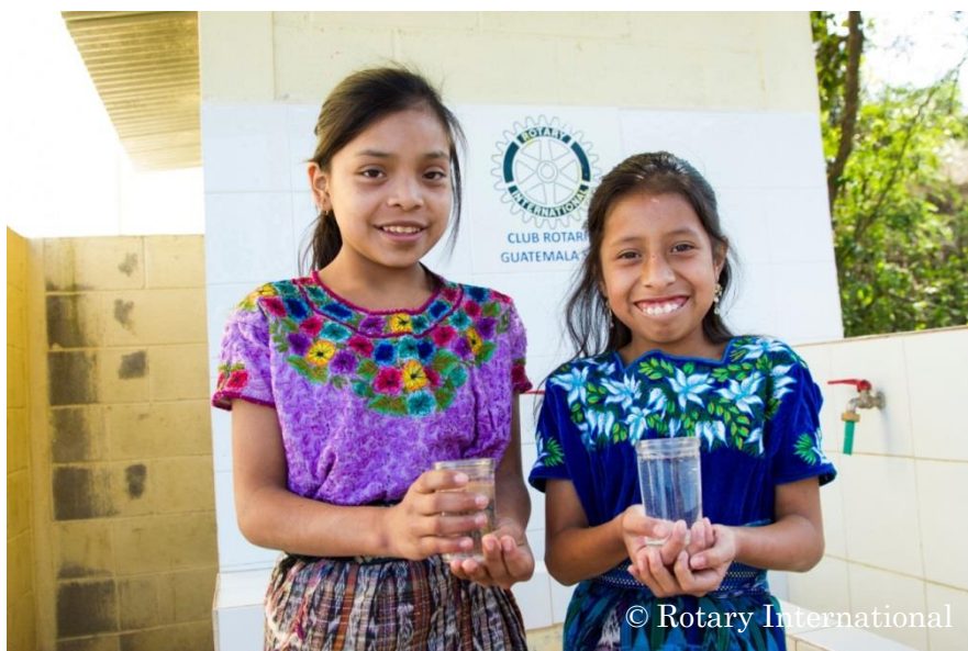
グローバル補助金にて改善されたキレイな水を持つ少女（グアテマラ）