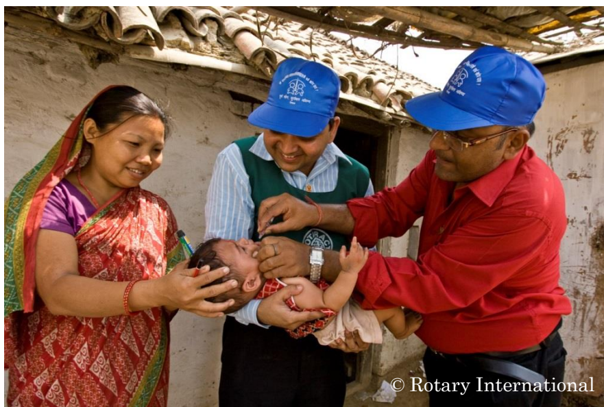
ポリオワクチンを投与するロータリアン（ネパール）