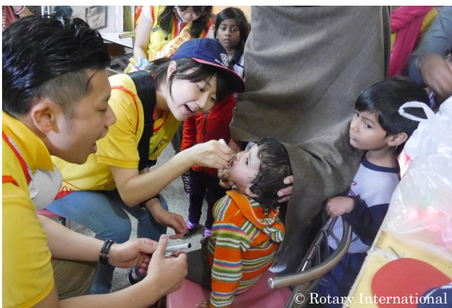
インドでのポリオ予防接種活動に日本から参加したローターアクト （インド）