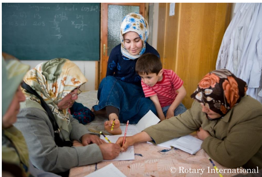
ロータリーが支援している識字プロジェクトにて、 足の指を使いながら読み書きを習う女性（トルコ）