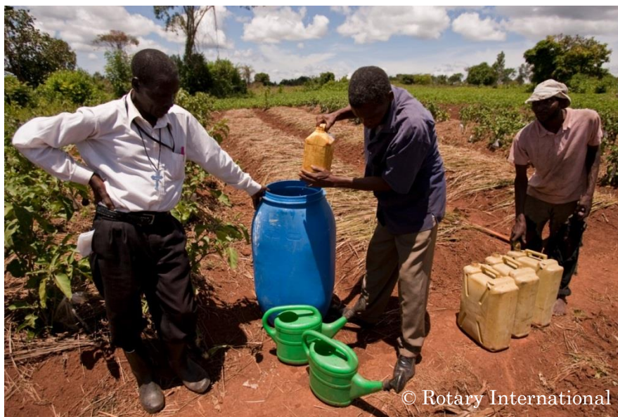
新しい栽培方法を学ぶ男性（ウガンダ）