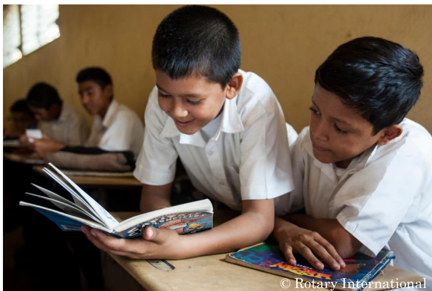
職業学校で勉強している小学生（ニカラグア）