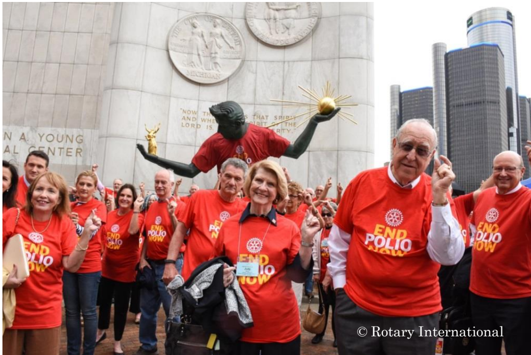
“The Spirit of Detroit” 像の前であと少しのサインをする 2016-17 年度ジョン・ジャーム RI 会長（アメリカ）