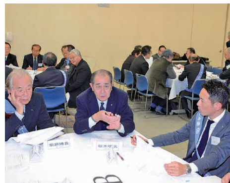
第2分科会における討論