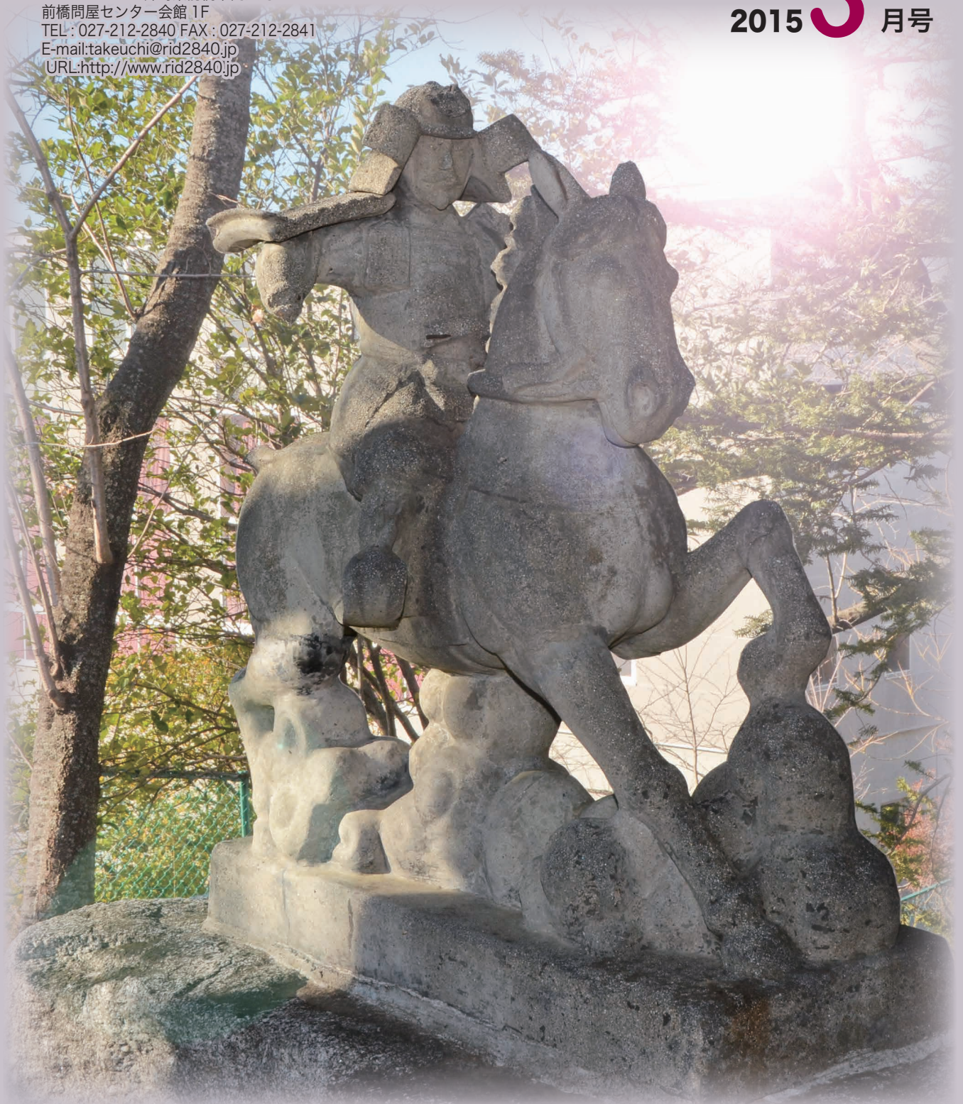
埼玉県本庄市児玉にある雉岡（きじおか）公園内の新田義貞像（石像）