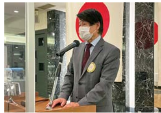
アレキサンドラさん演奏御礼代読 中森君