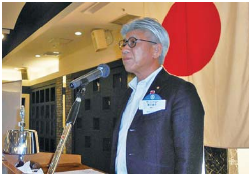
ガバナー補佐スピーチ 国際ロータリー第2840地区 第3分区ガバナー補佐 関口 俊介様