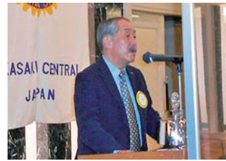
乾会長エレクト 新型コロナワクチン 接種状況について