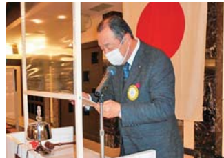
出席報告 栗原出席担当副委員長