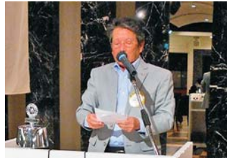
ニコニコBOX報告 高木ニコニコBOX副委員長