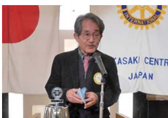
ロータリー財団寄付報告 水上財団事業委員長