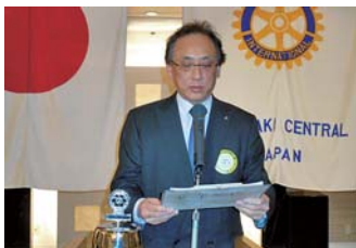
出席報告 井田出席担当委員長