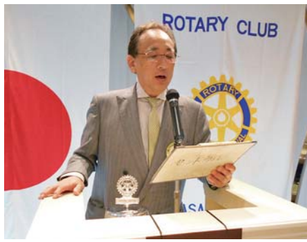
出席報告 井田出席担当委員長