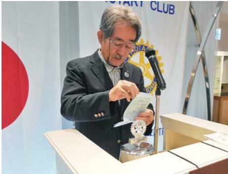
ロータリー財団・米山奨学会寄付報告 水上財団事業委員長