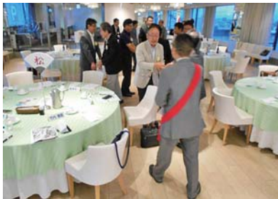
本日の例会場は 9階ポム・ドールでした