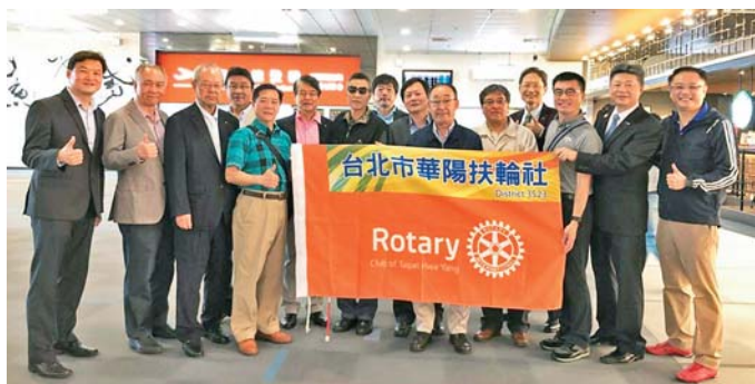
4/20 空港にて また会いましょう!