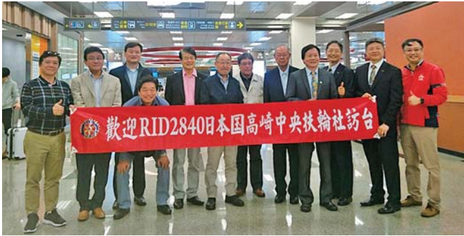
4/18 お出迎え(空港にて)