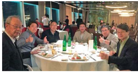
4/18 最上階レストラン(欣葉 101)で夕食