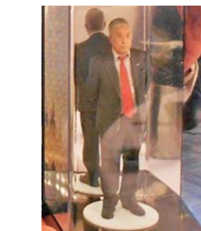
石田さん自身のフィギュア