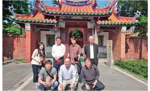
4/19 7人勢揃い(孔子廟にて)