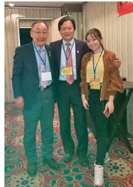
黄会長・娘さんと