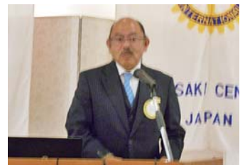
石橋ロータリー情報委員長 ニコニコ、財団、米山等の案内