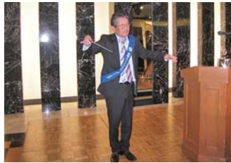
高木ソングリーダー代理