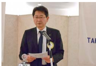
浜辺来期幹事より報告