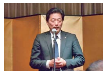
閉会挨拶 関口会長エレクト