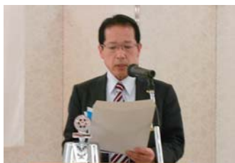
須永会員組織委員長