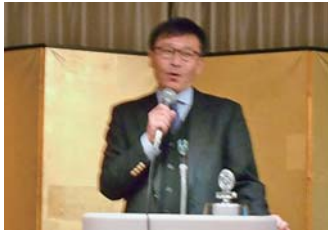
橋爪シンフォニー会長挨拶