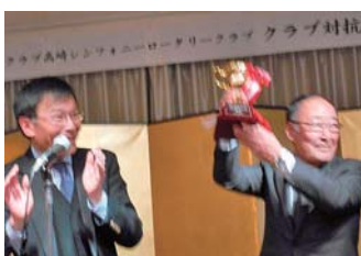
表彰 セントラル優勝