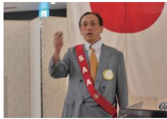
井田ソングリーダー