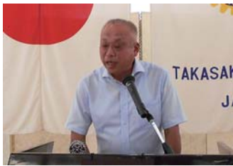
出席報告 淡島出席担当委員長