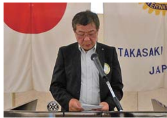
ニコニコBOX報告 多胡ニコニコBOX委員長