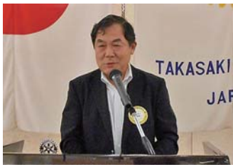
ロータリー財団寄付報告 加藤財団事業委員長