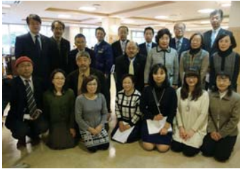
本日参加のコーラス部員 プラスその他のメンバー