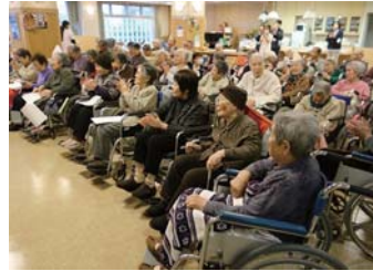
皆さん手拍子をしながら一緒に歌い、アンコールは「ふるさと」を3回も！