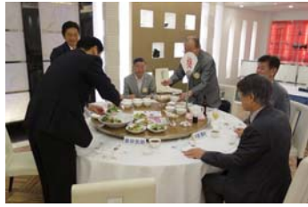
月に一度は自分たちで食事を分ける