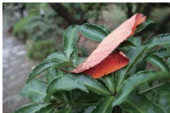
桜の紅葉も意外ときれい