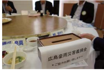
今日もまた広島豪雨災害義捐金を