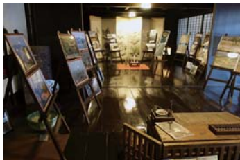
千曲市稲荷山では、かつて江戸から明治にかけて隆盛を誇った商家が「蔵し館」という資料館になっている