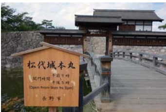
復元された信州松代城