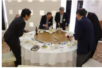
こちらは細心の注意を払って均等に仕分け作業を