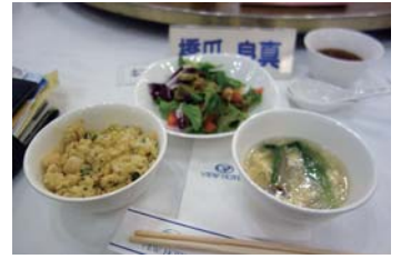
これがその今日のメニュー