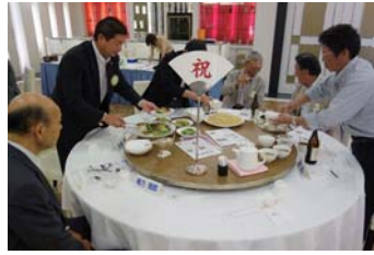
いつもは品数が多いので盛りつけは全員参加になるのですが、今日はなぜかチャーハン・スープ・サラダのみ