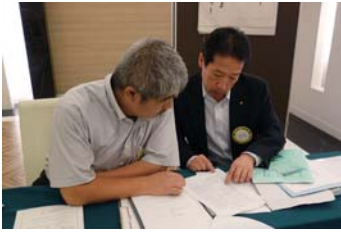
真剣な打ち合わせに顔を向けてくれと声をかけられない