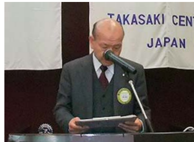
◀ 嶋方出席担当委員長