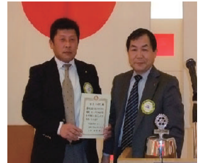
2年間100%出席おめでとうございます。