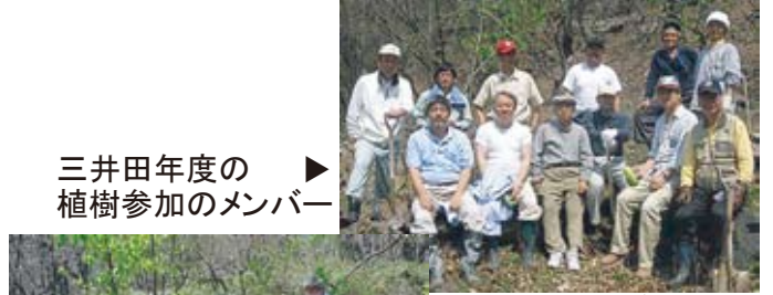
▶三井田年度の 植樹参加のメンバー