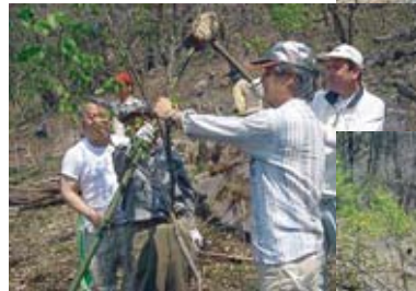
◀植えたブナの 支え棒の 打ち込み