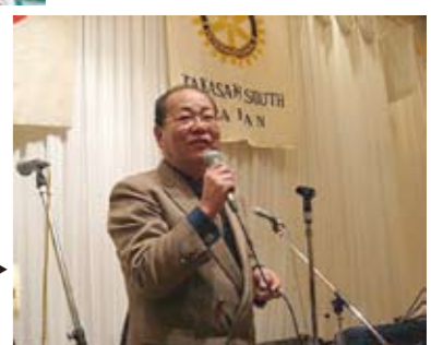
セントラル副酒井君が 高崎まつり流に3本メ