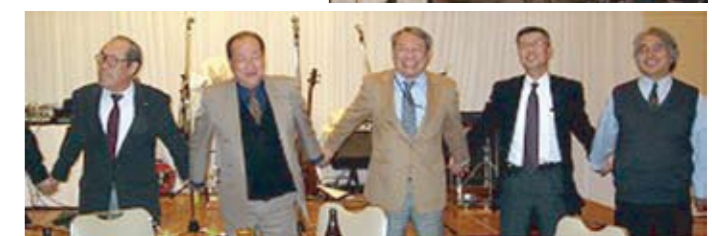
▲ロータリー恒例の手にてつないでを大合唱