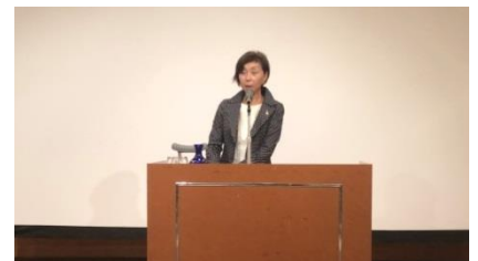
横尾会員(高崎東RC)の発表