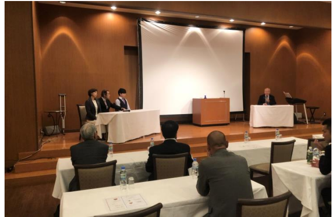
宮内会員組織強化委員長によるシンポジウム

新会員セミナーの受講者、地区内27クラブ62名の新会員と地区役員他、総勢81名の方が集まり、新会員セミナーが開催されました。