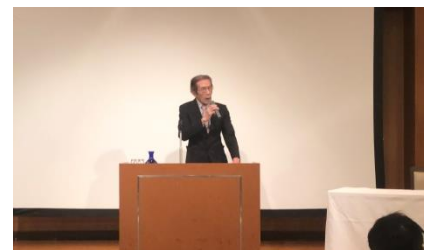
大井会員(前橋西RC)の発表