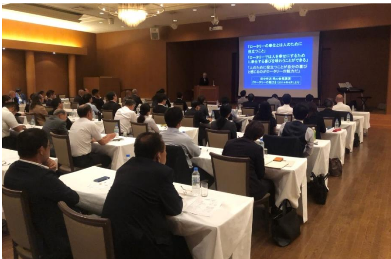
本田パストガバナーによる基調講演