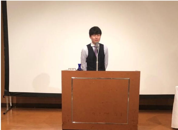
金子会員(桐生RC)の発表