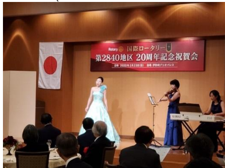
オープニング(メゾ・ソプラノ、ヴァイオリン、ピアノ)