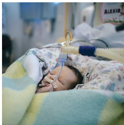
幼い命を救う医療支援

母乳に関する母親への指導、予防接種と定期健診の推進、防虫加工の蚊帳の配布など、赤ちゃんを守るための支援をしています。