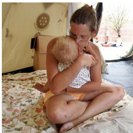
1歳を迎えられるように

母乳に関する母親への指導、予防接種と定期健診の推進、防虫加工の蚊帳の配布など、赤ちゃんを守るための支援をしています。