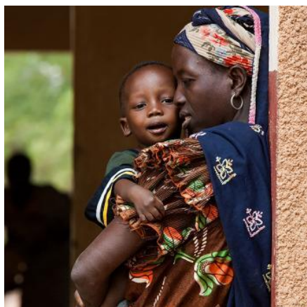
持続可能なプログラム

教育、予防接種、出産キット、移動クリニックなど、ありとあらゆる方法で母子の健康を推進しています。また、女性を対象に、HIV母子感染の予防、母乳による授乳、病気の予防に関する教育も行っています。