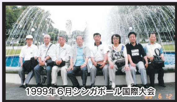
1999年6月シンガポール国際大会