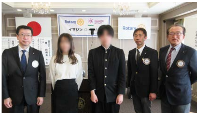
沼田中央ロータリークラブ育英奨学生