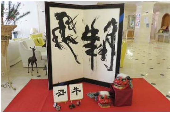
ホテルペラヴィータのロビー