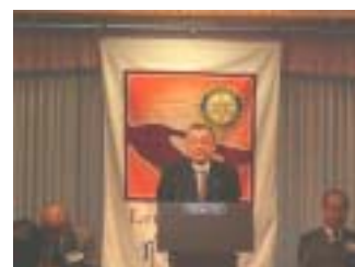
富田ロータリー財団委員長