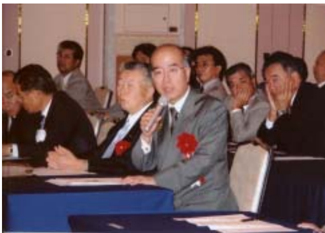
ガバナーへの突然の質問