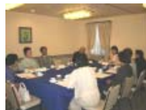
グループ・ディスカッション