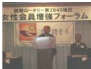
清パストガバナー (フォーラムリーダー)