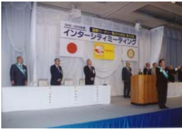
ロータリーソング斉唱