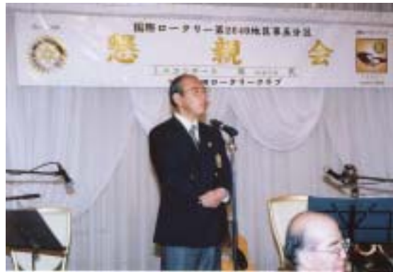
阿形第5分区アシスタントガバナー