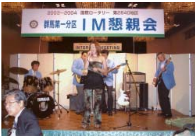
懇親会アトラクション