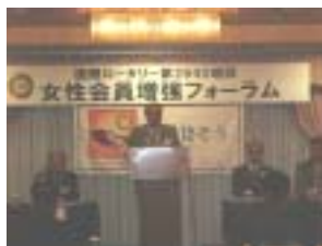
北村地区問題委員長