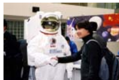
宇宙飛行士?と握手!