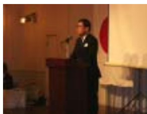
伊能国際奉仕委員長