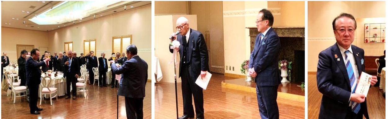
高木パストガバナー激励の言葉

歓談後、宮内ガバナーより森田ガバナーエレクトへ饞別が贈呈され、清パストガバナーの閉会挨拶で終了となりました。