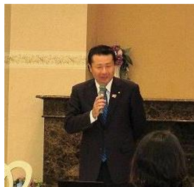
原 敬 委員長挨拶