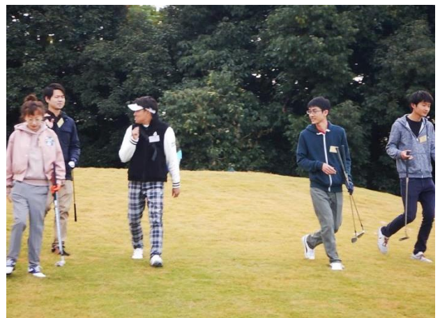
ショートコースラウンド