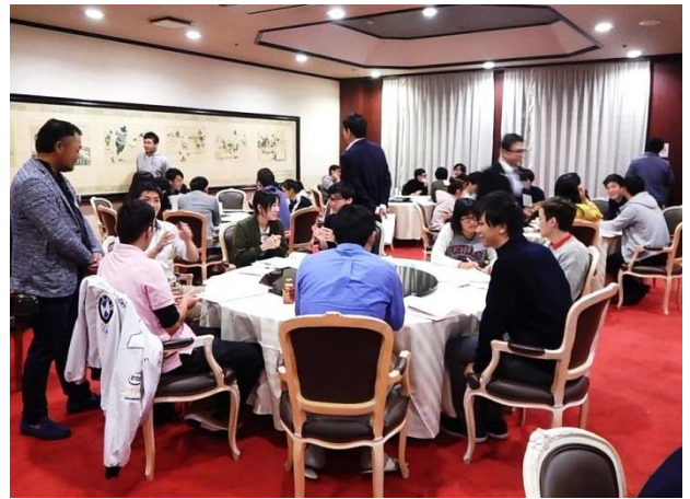
戦略会議・目標設定