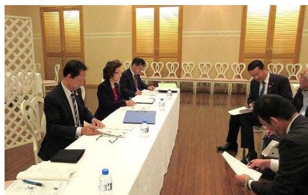
青少年交換委員会