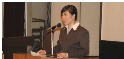
新規米山記念奨学生代表挨拶