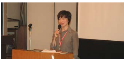
大路潔江学友会会長挨拶