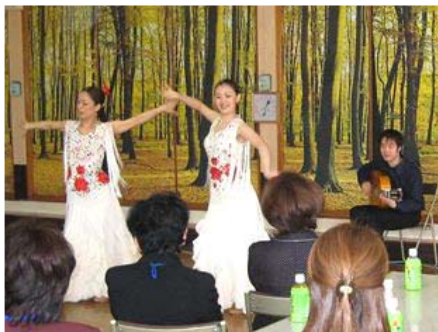
お楽しみタイムの様子