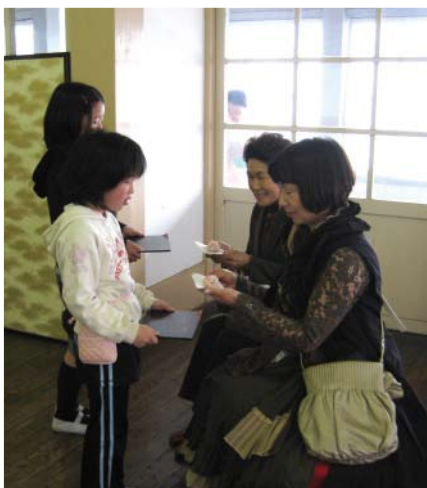
子供達よりセミナー前の一腹

最初の研修メニューは、第2750地区・東京銀座ロータリークラブの市川伊三夫パストガバナーを講師に迎えての講演会である。市川先生は「期待する女性ロータリアンの力」と題した約70分の講演で、女性の力がいかに偉大かという事を様々な事例を挙げてお話しされ、女性会員の活躍に期待を寄せられ、その重要性を示された。先生のユーモアあふれるお話に誘われて起きる笑い声は、会場の雰囲気をも和ませるとともに、花冷えの寒さをやわらげてくれたようだ。