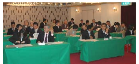
オリエンテーションの全体の様子