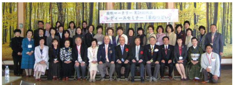
参加者全員で集合写真