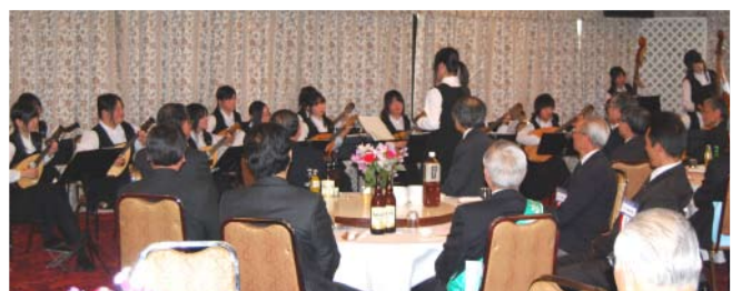
館林女子高校マンドリンギター部の演奏の様子