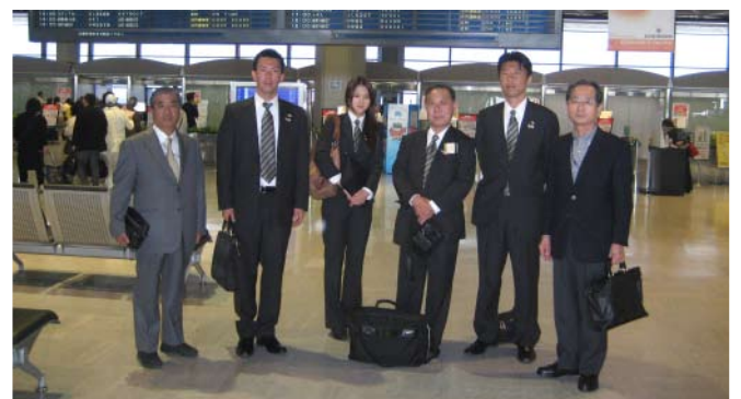
GSEチーム、大韓民国へ出発直前