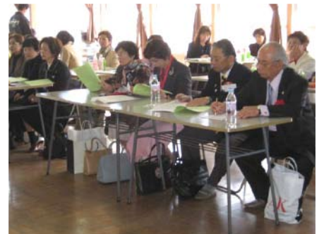
富岡製糸場の歴史について聞き入る参加者の様子