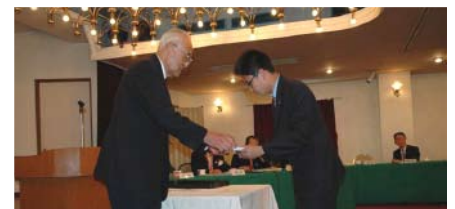
奨学金交付の様子