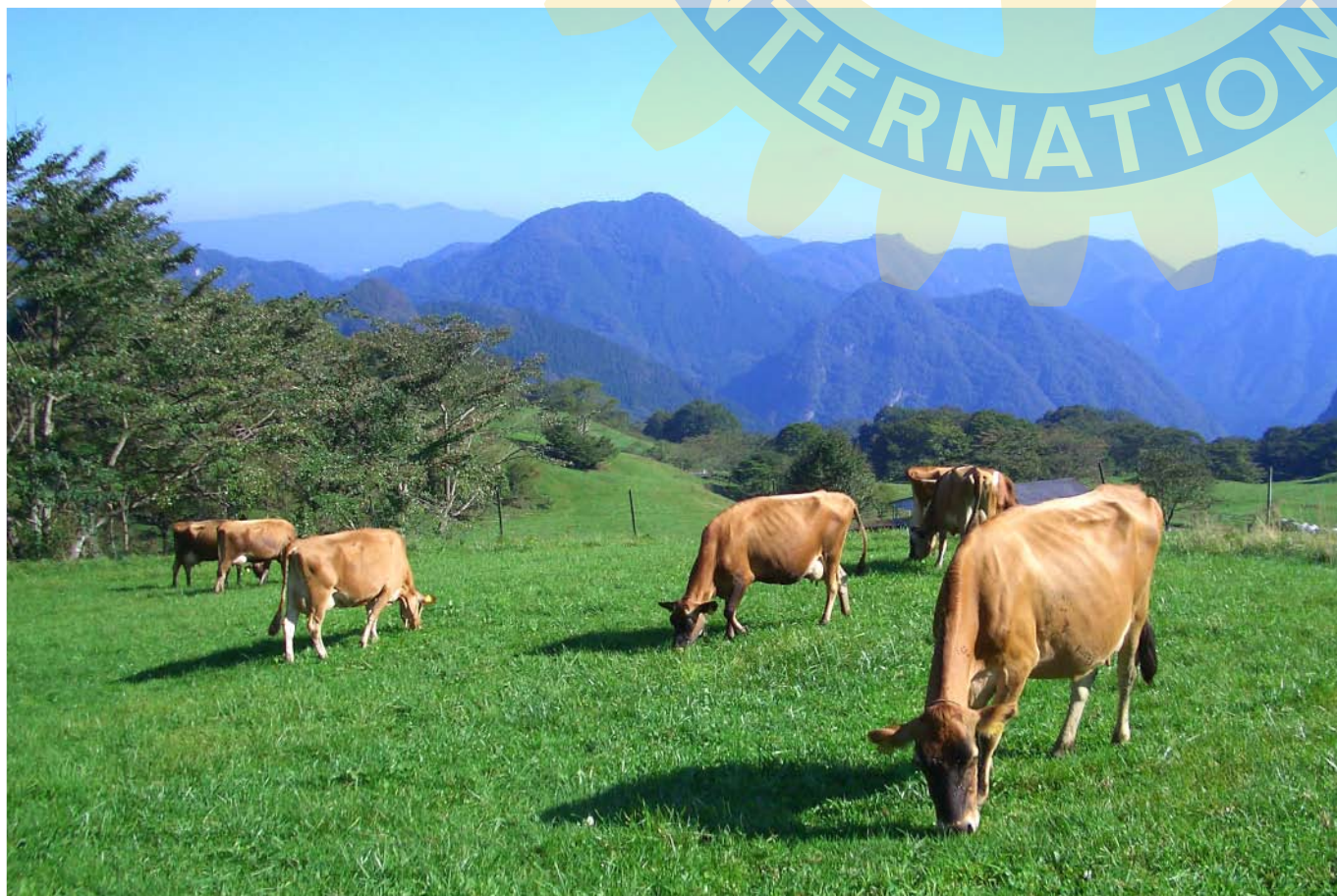
今月の写真 ● 日本初の洋式牧場 神津牧場 自給飼料を活用して健康なジャージー牛を飼養しています。新鮮な生乳を元に、牛乳・乳製品の生産から販売なども行っています。