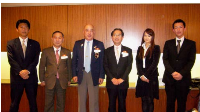
ガバナー、内山委員長、GSEメンバー（歓送会にて）