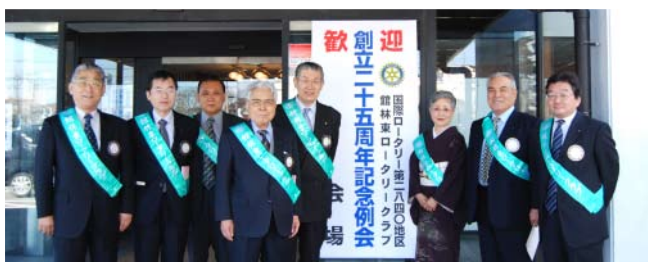
館林東ロータリークラブの会員