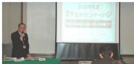
中繁委員長の説明