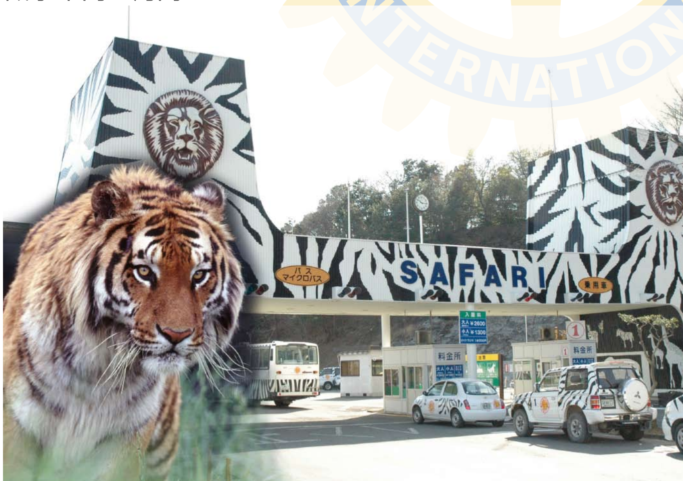
今月の写真 ●群馬サファリパーク ホワイトタイガーをはじめ、ライオン、トラ、シマウマ、キリンなど 100 種 1,000 頭羽もの動物や鳥が展示されています。