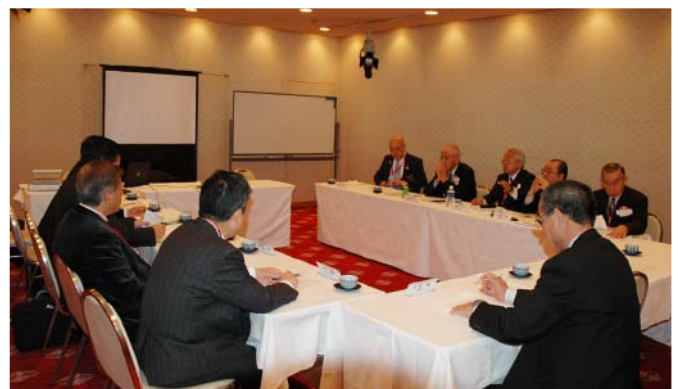
選考会審議の様子