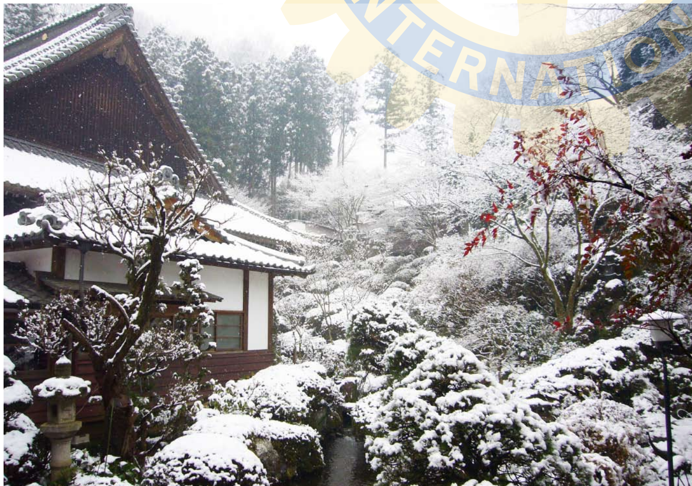
今月の写真 ● 光厳寺 初雪の庭園 富岡市にある曹洞宗のお寺。「三日ぼうずの会」という座禅会があり、毎月 1・2・3 日に座禅が体験できます。