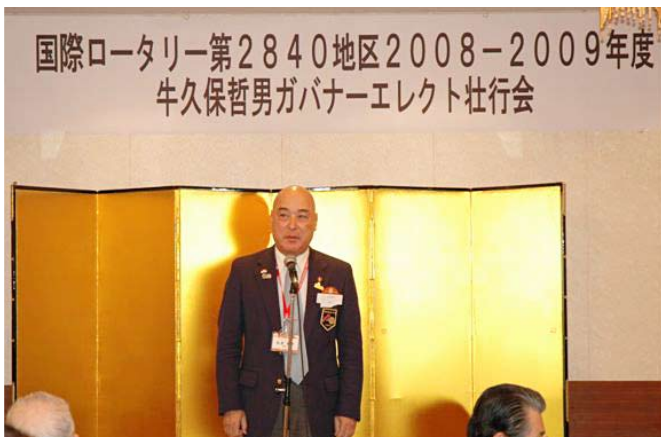
松倉ガバナー挨拶