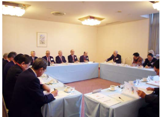
諮問委員会の様子