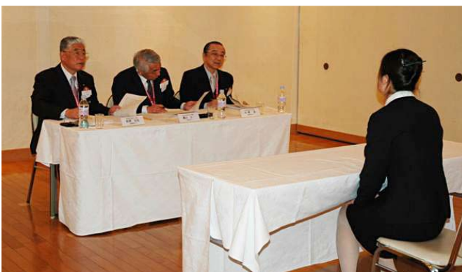
学生面接の様子（3組）