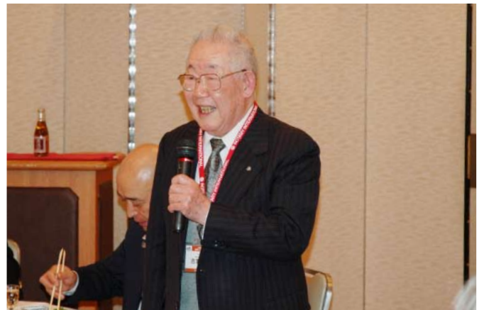
吉野パストガバナー激励の言葉