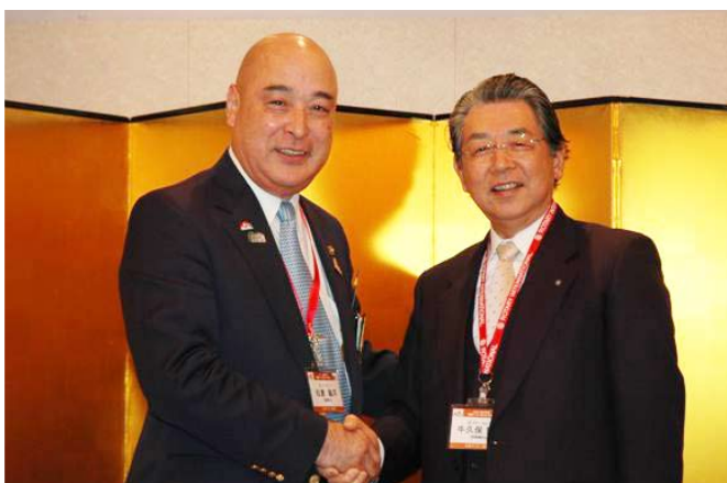
固い握手を交わす松倉ガバナーと牛久保ガバナーエレクト