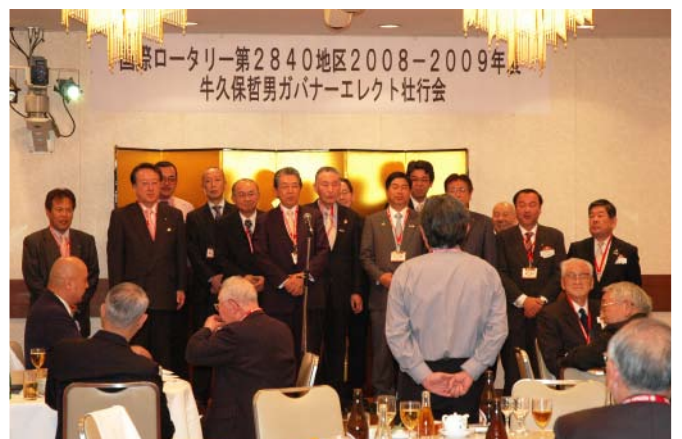
現・次年度ガバナースタッフによるエール