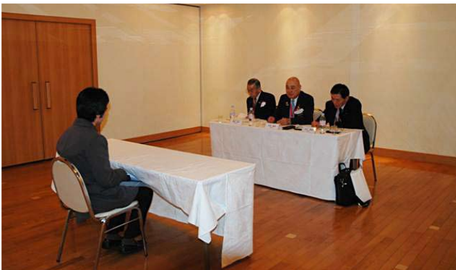
学生面接の様子（1組）