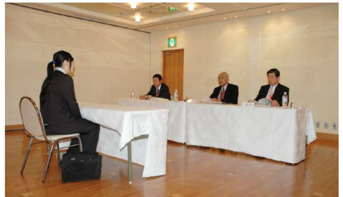
学生面接の様子（2組）