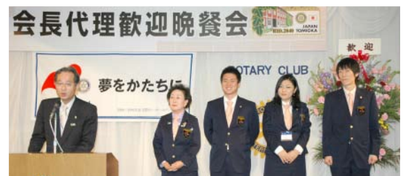
韓国 GSE チーム紹介