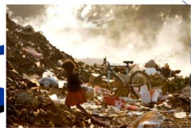
子供たちの「夢をかたちに」