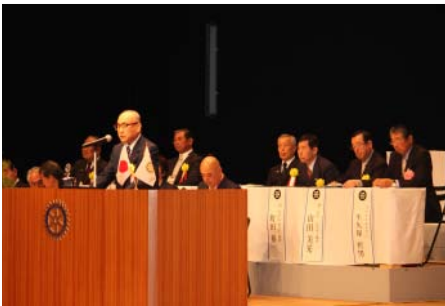
ガバナー補佐によるクラブ紹介