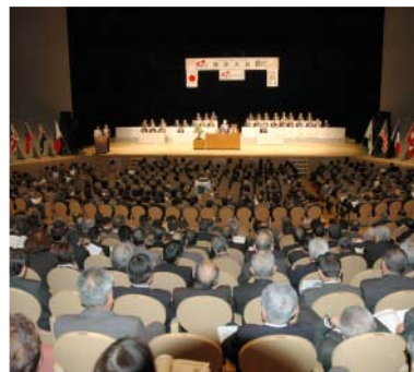
地区大会本会議場の様子