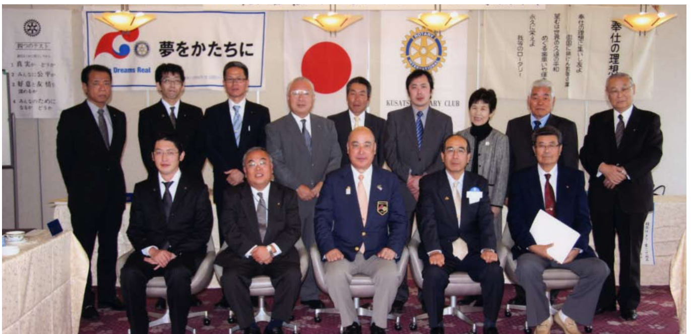
ガバナーを囲んで

その後、質疑応答の時間を終え、クラブ会員と記念撮影をし、ガバナー公式訪問を無事終了致しました。