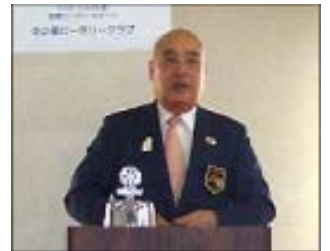
ガバナー講話の様子