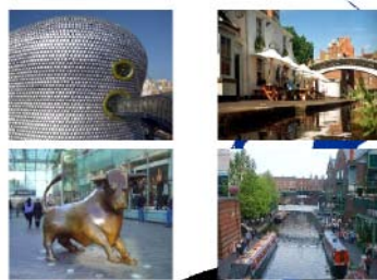
バーミンガムを楽しむ