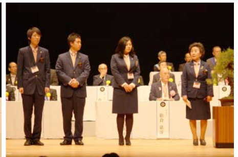
韓国 GSE チームメンバー紹介