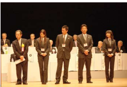
GSE 派遣メンバー紹介