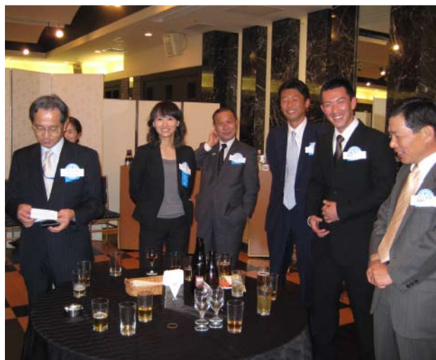
来年訪問します。よろしく