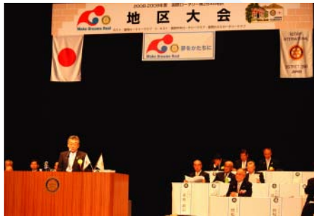
地区委員長活動報告