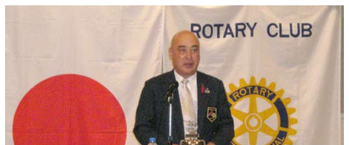
ガバナー講話の様子