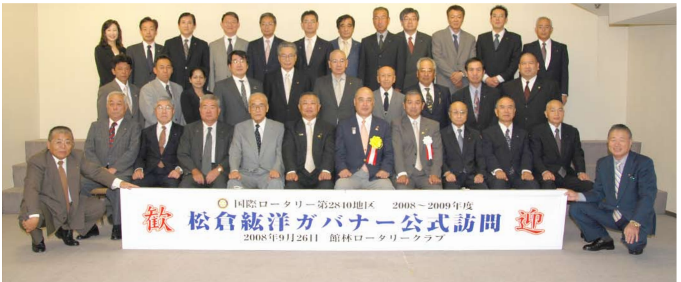
公式訪問記念写真

そして、ロータリーの基本である例会を充実させることの重要性も説いておりました。「3つの、掛け運動」を徹底していくことで、出会いの場を広げ、充実させていき、優れた人たちと顔を合わせられるという事は、まさに人生の宝であると話されてた事は心に深く浸み入りました。本当にありがとうございました。