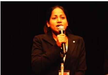
米山記念奨学生代表挨拶