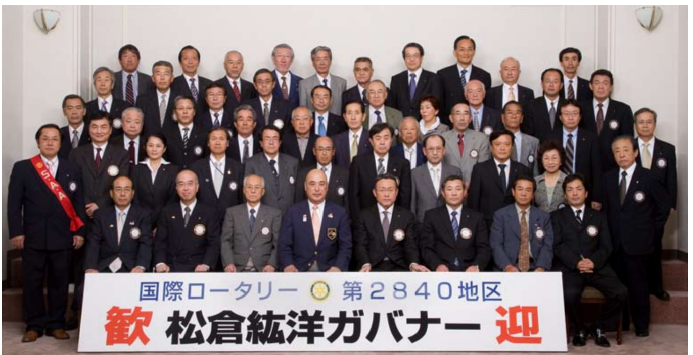
松倉ガバナー訪問記念