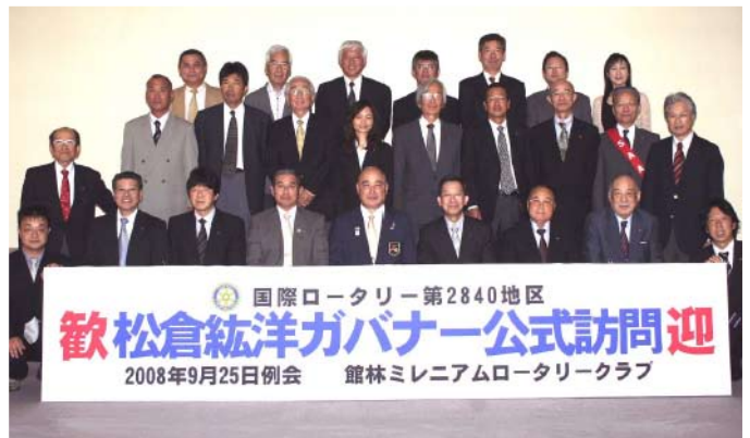
ガバナー公式訪問記念