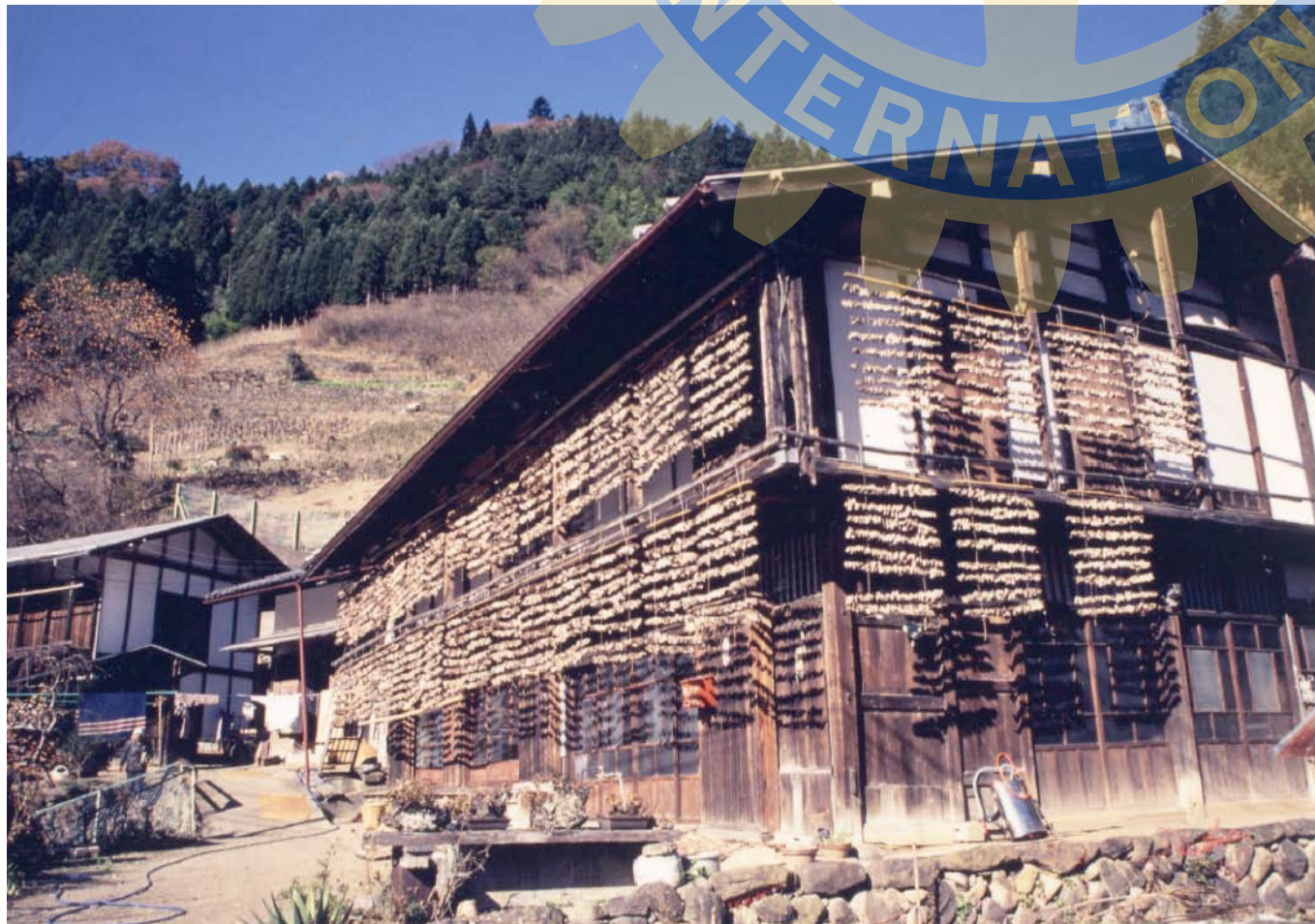
今月の写真 ● こんにやく天日干し 天日とからっ風を利用した、200年以上続く乾燥加工法。非常に手間と時間がかかる為、この工法で作業する農家もごく僅かです。