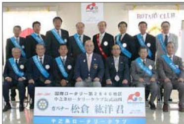
ガバナーを囲んで

例会終了後、コーヒータイムと記念撮影が行われ地区大会参加の意欲を噛みしめて閉会となりました。