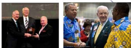
ロータリーのリーダーに会う