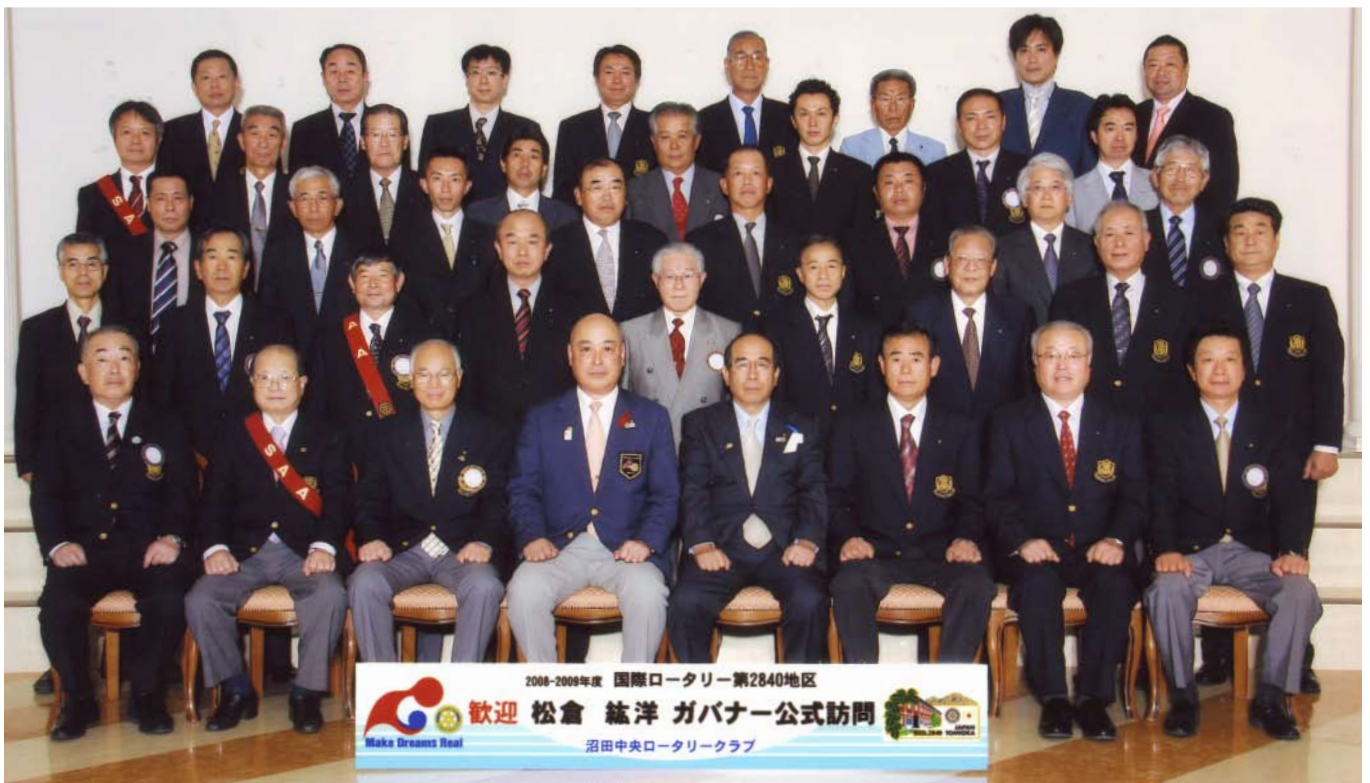
ガバナーを囲んで

松倉ガバナーの卓話は1、「RIの現状を踏まえて」2、「地区目標(TARGET)」3、「数値目標」を話されました。そして最後に禅語「一超直入」を頂き終了しました。例会終了後、「ロータリーの森」の視察をされてお帰りになりました。今回の公式訪問は、私たちメンバーにとって非常に意味深いガバナー公式訪問でした。