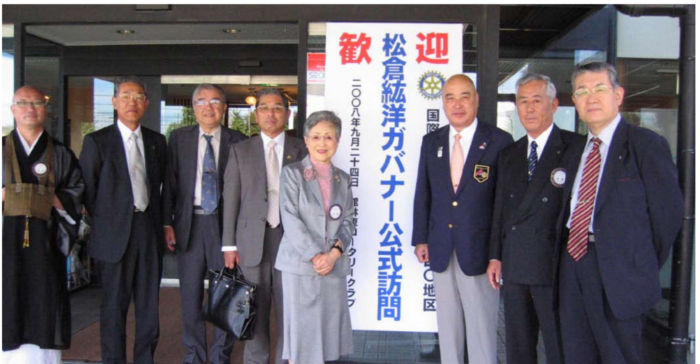
松倉ガバナーと共に