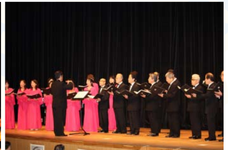
素晴らしい歌声の高崎シンフォニー RC 合唱団