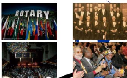
100回目の国際大会と親睦を祝う