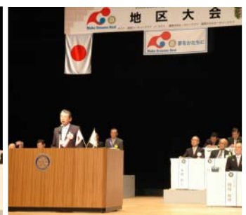
牛久保ガバナーエレクト挨拶