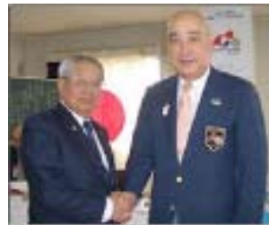
入会推薦者へバッジ