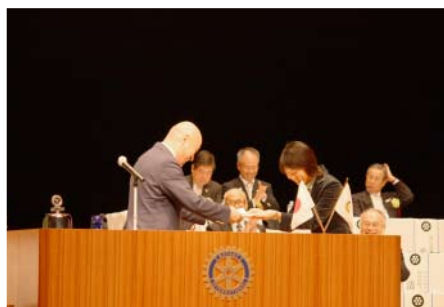
地区大会記念事業目録贈呈