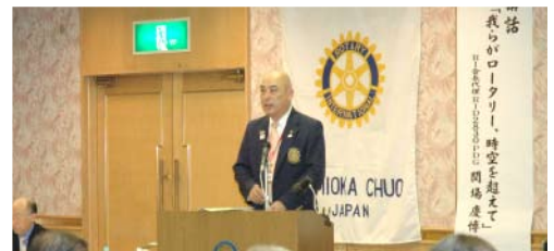
松倉ガバナー挨拶