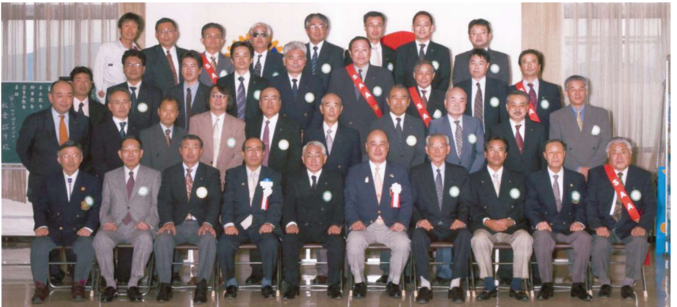
松倉ガバナー訪問記念