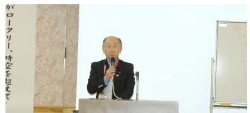
清章司研修リーダーによるセミナーの目的