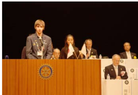
青少年交換留学生のスピーチ