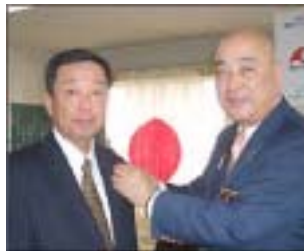
新会員とガバナー