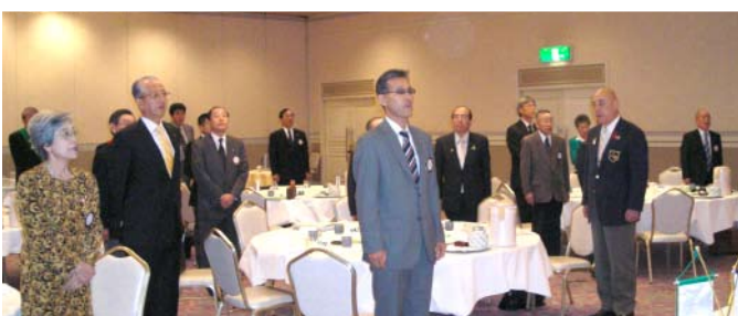
君が代及びロータリーソング斉唱