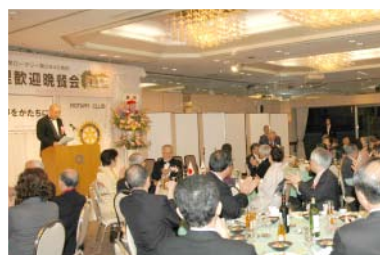
松倉ガバナー挨拶