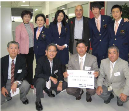
韓国 GSE メンバーを空港でお出迎え

チームは地区行事の11月7日のRI会長代理歓迎晩餐会と11月8日の地区大会に参加して11月10日帰路につきます。