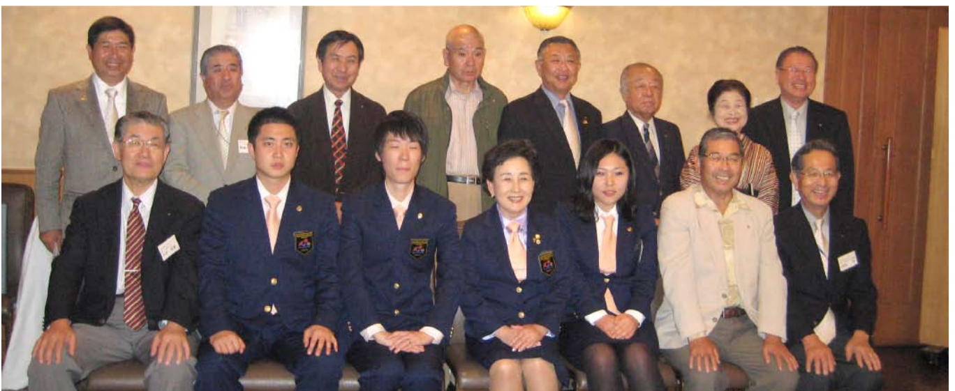
韓国 GSE チームと受け入れクラブで記念撮影