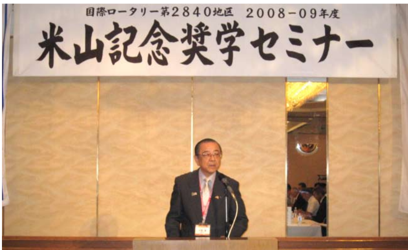
挨拶をする中繁委員長

尚、ガバナー補佐をはじめ地区役員の皆様方には大変お世話になり誠にありがとうございます御座いました。