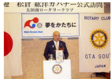
ガバナー講話の様子