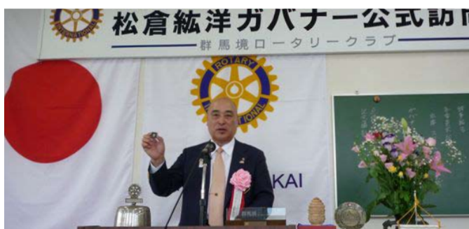
ガバナー講話の様子