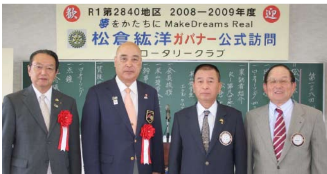
松倉ガバナーと共に