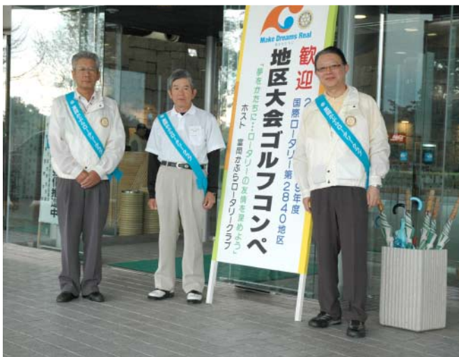
ゴルフ参加者をお迎えする 富岡かぶら RC の実行委員長と会長幹事

ご参加頂いたロータリアンの皆様には心より感謝申し上げます。ご協力ありがとうございました。