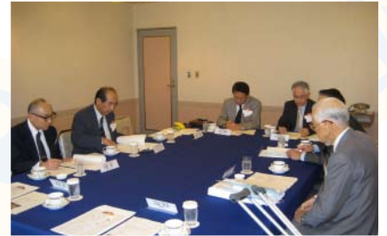
規定審議会立法案検討委員会の様子