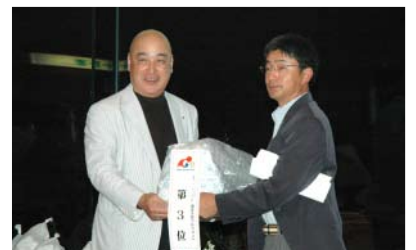
商品をお渡りする松倉ガバナー