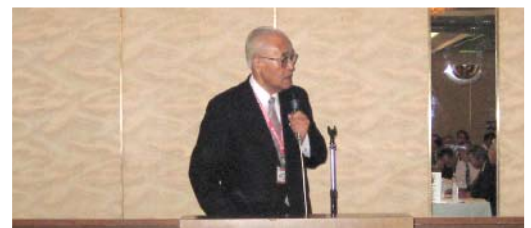
高木米山記念奨学会常務理事の説明の様子