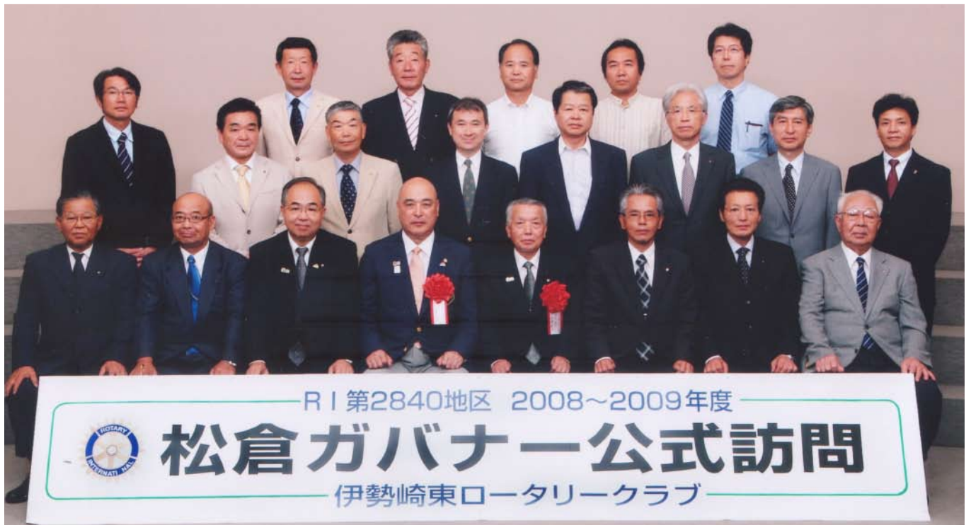
松倉ガバナーを囲んで記念撮影