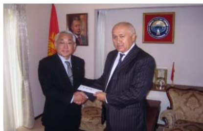
在日キルギス共和国大使館にて義援金贈呈の様子