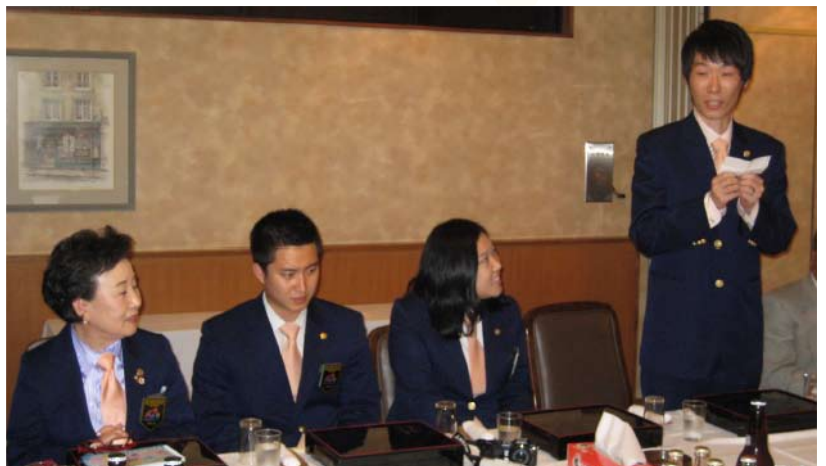
韓国 GSE メンバー自己紹介の様子