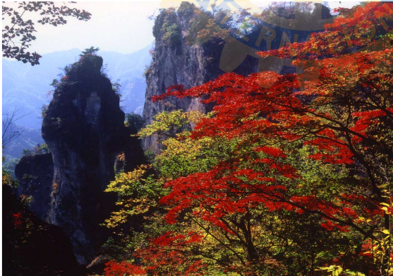
今月の写真 ● 紅葉に映える妙義山 猛々しい岩肌と暖かく色づいた葉が織りなすコントラストの美しい景色を楽しめます。見頃は 11 月上旬から中旬。