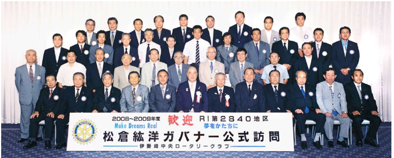
松倉ガバナーを囲んで記念撮影

尚、当日はガバナーの老人ホーム施設内で、大沢県知事の慶祝訪問(県内最高齢者)と重なったとの事、お忙しい中訪問していただき、心より御礼申し上げます。