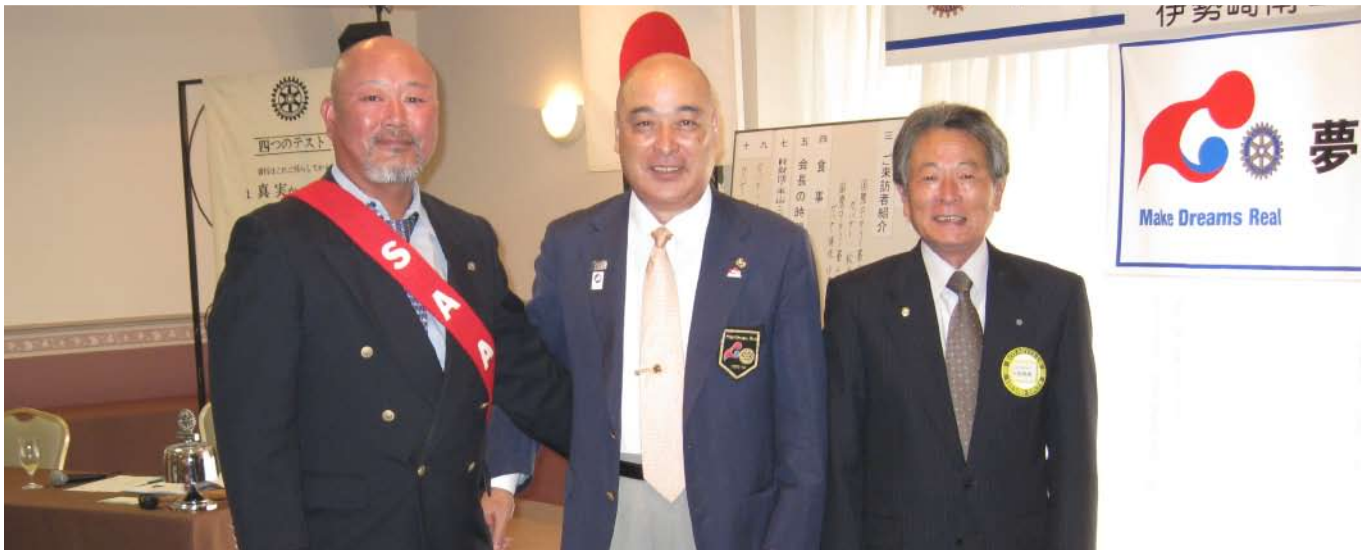
松倉ガバナーと共に