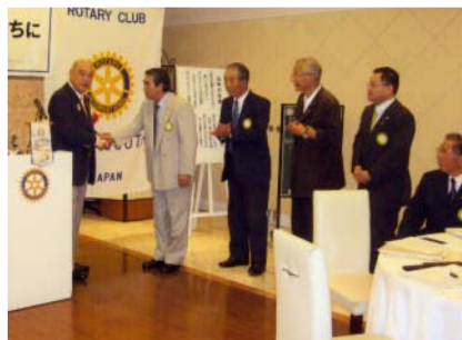
新会員紹介者への スポンサーバッジ授与