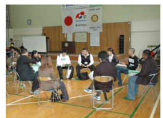
グループ ディスカッションの様子