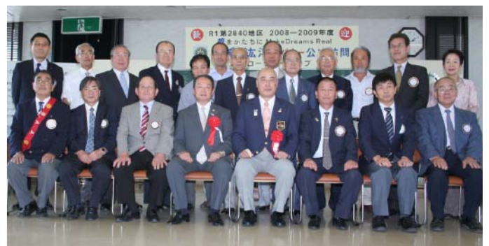
松倉ガバナーを囲んで記念撮影