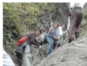
ハイキングの様子