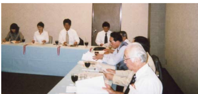
オリエンテーションの様子