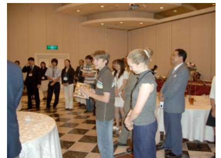
歓迎会・壮行会の様子