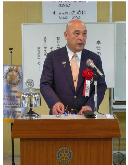
松倉ガバナー講話の様子

この講話は、45分間がとても短く感じられて素晴らしいお話でした。有難うございました。例会終了後全員で記念撮影を行いました。