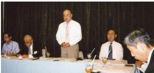
松倉ガバナー挨拶

オリエンテーションは来年 4 月の出発までに数回の開催を予定しておりますが派遣チームの皆さんに対してのアドバイスや現地 (大邱市) 情報等の提供をお願いいたします。