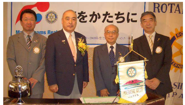
松倉ガバナーと新会員