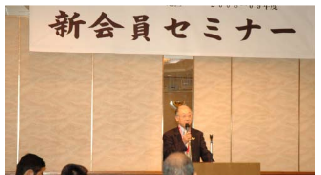
清研修リーダーの講話