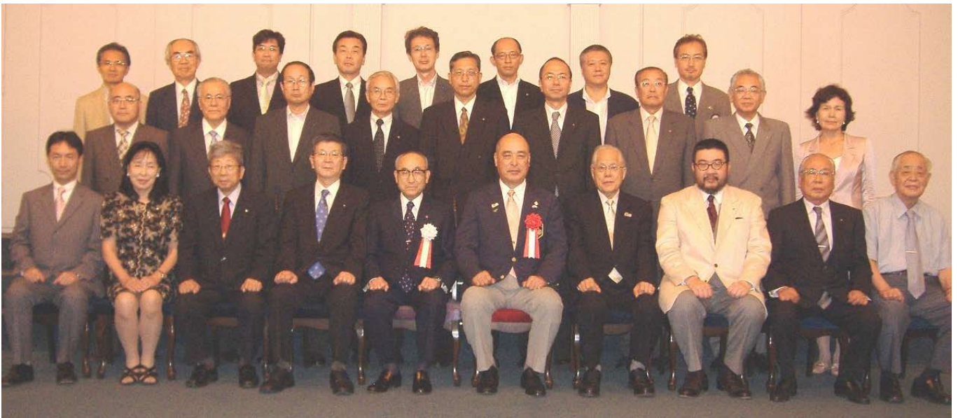
松倉ガバナー公式訪問記念撮影

このあとガバナーは、高崎6RC会長と上毛新聞高崎支社を訪問されました。その後、第3分区会長幹事・ガバナー補佐・パストガバナーでノミネー候補者検討会議を行い、会議後、高崎6RC合同でガバナーを囲んでの懇親会に出席されるという多忙な1日でした。