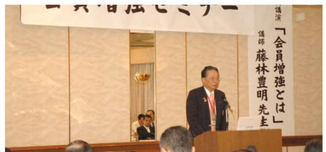
曾我パストガバナー講話