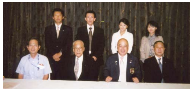
派遣チームメンバーと