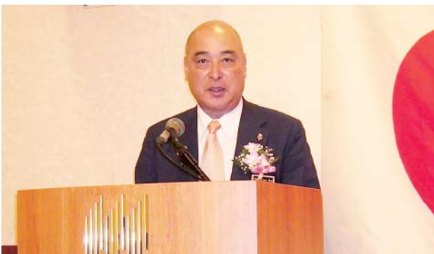
松倉ガバナー講話の様子