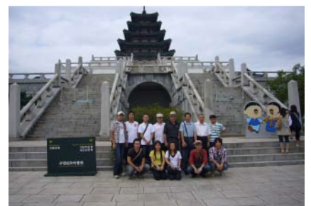
ソウルインターロータの様子