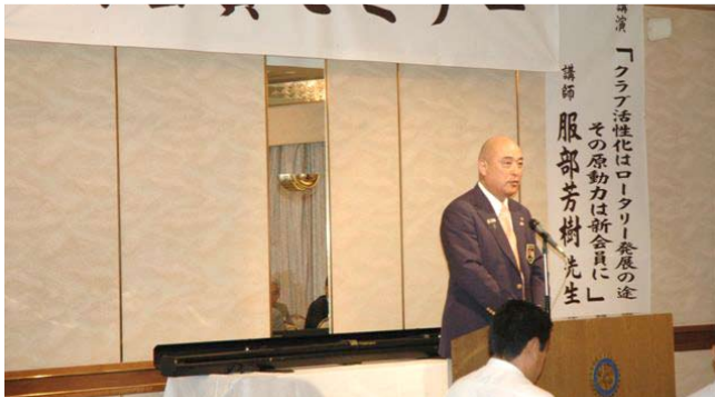
松倉ガバナー挨拶