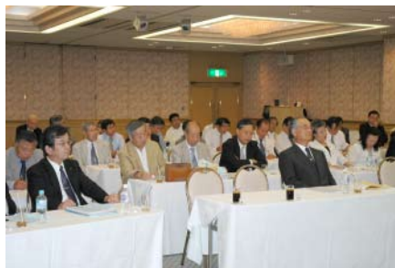
クラブ研修リーダーの皆様