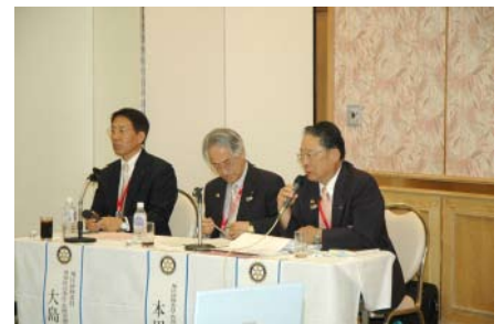
地区研修委員の皆様