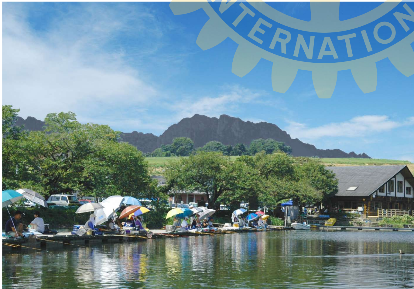
今月の写真 ● 丹生湖 へら鮎釣り 丹生湖は湖面に妙義山の美しい稜線を映し出す人造湖。61年から市の管理釣り場として、へら鮎やワカサギ釣りの人々で賑わいます。