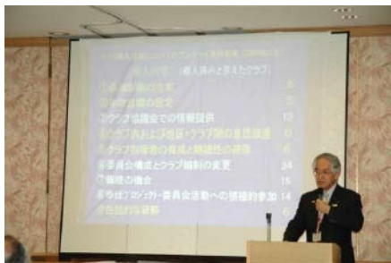
本田地区研修委員プレゼンテーション

なお、説明会で使用したパワーポイントの資料は、地区ホームページの「クラブ研修リーダーのページ」に掲載しておりますので、ご参照ください。