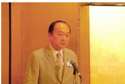
島津高崎北 RC 会長挨拶