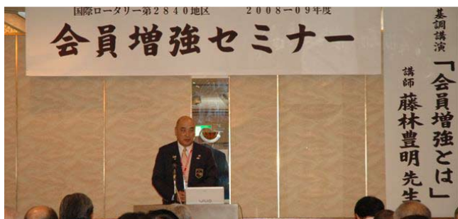
松倉ガバナー挨拶