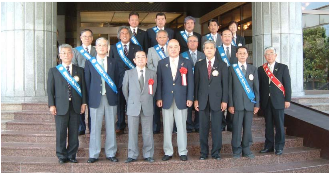
松倉ガバナー公式訪問記念撮影