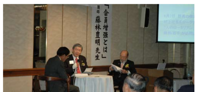
大好評だったQ&A寸劇