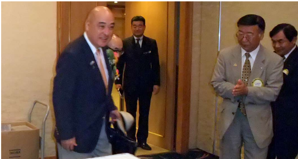
松倉ガバナー到着