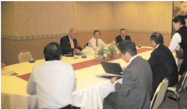
松倉ガバナー公式訪問の様子

例会前に会長、幹事、会長エレクト、地区役員、理事との懇談会に於いて当クラブに対してご指導を頂き、例会にて、RI会長のメッセージと地区方針のスピーチを頂きました。